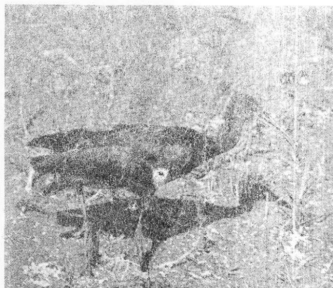
Foto 1: Plevica Plegadis falcinellus, 15. 8. 1988, ribnik Gressedlinger pri Wolfsbergu

Rožnati pelikan Pelicanus onocrotalus : 28. 5. 1965 se je zadrževalo na Hodiškem jezeru (Keutschocher See) 5 osebkov, od katerih je bil eden domnevno poškodovan in zato ustreljen. Preparat tega, po poročilih z decembra 1892 in julija 1927 za Koroško tretjega