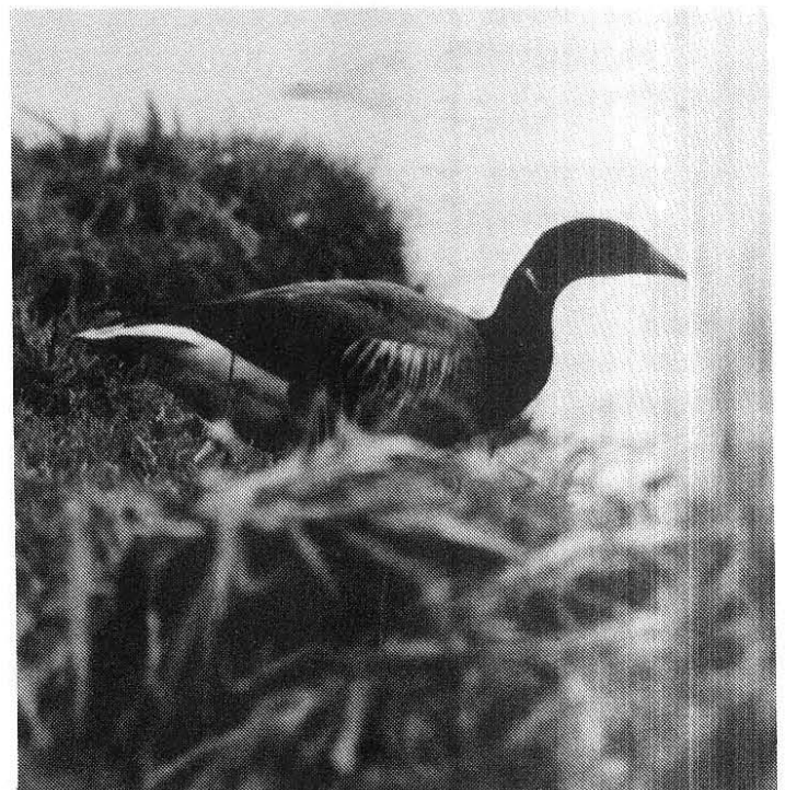
Foto 3: Grivasta gos Branta bernicla, 28. 3. 1991 na Velikovškem zbiralniku (Völkermarkter See)