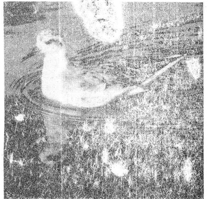
Foto 4: Ploskokljuni liskonožec Falaropus fulicarius, 5. 5. 1991 na Dravskem zbiralniku (Draustausee) pri Mauthbrücknu