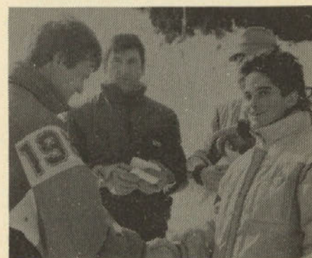
Med podeljevanjem priznanj po končanem tekmovalstvu

1. J. mehanizacija, 2. TE Šoštanj, 3. Izobraževanje, 4. J. Preloge, 5. ESO, 6. J. transport, 7. J. Škale /Draga Lipuš/