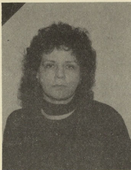
Dopisnica našega glasila pesnica

Marsikateri delavec v našem kombinatu vas pozna. In marsikdo pozna tudi vaše pesmi. Jih pišete že dolgo?