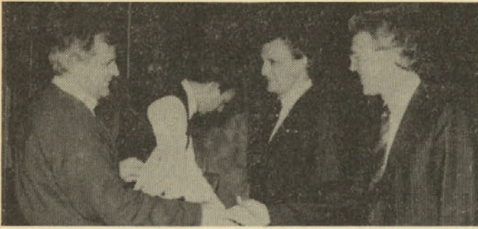
Med podeljevanjem tradicionalnih diplom našega kombinata na srečanju za inovacijsko dejavnost