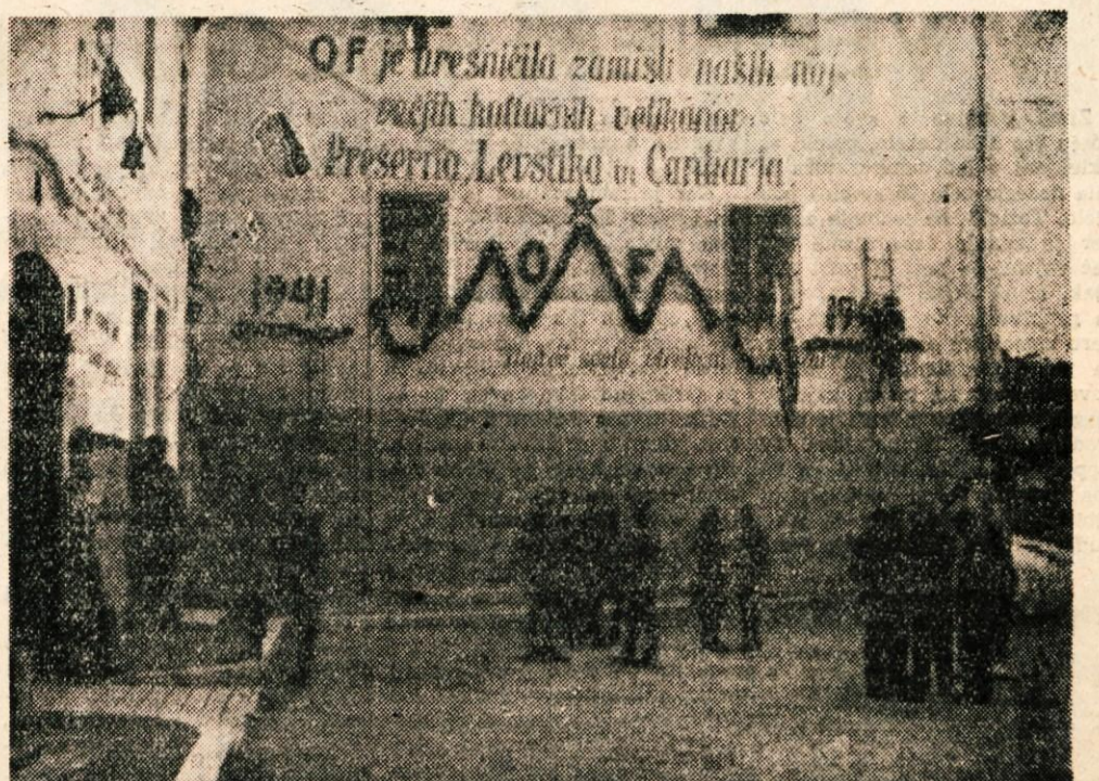
Tak je bil Črnomelj vedno: poln navdušenja, vere v našo zmago, borben in ponosen, vedno v prvih vrstah razgibanega političnega življenja in narodnoosvobodilne borbe