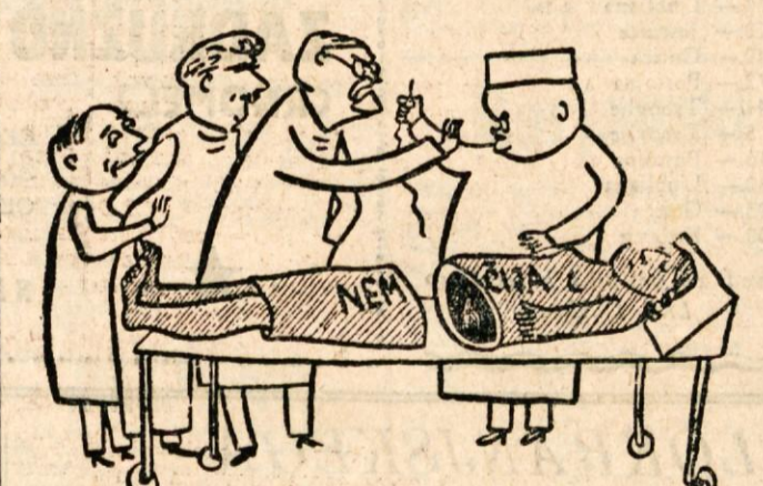
—Nou, mister Molotov, z rdečo nitjo pa ne! (Večer — Maribor)