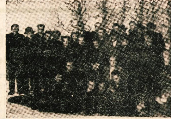
Udeleženci poljedelsko-semenarskega tečaja v Novem mestu

Pridelki v naših okrajih so prenižki, pa ne toliko zaradi slabih tal, pač pa zaradi nepravilnega obdelovanja zem-