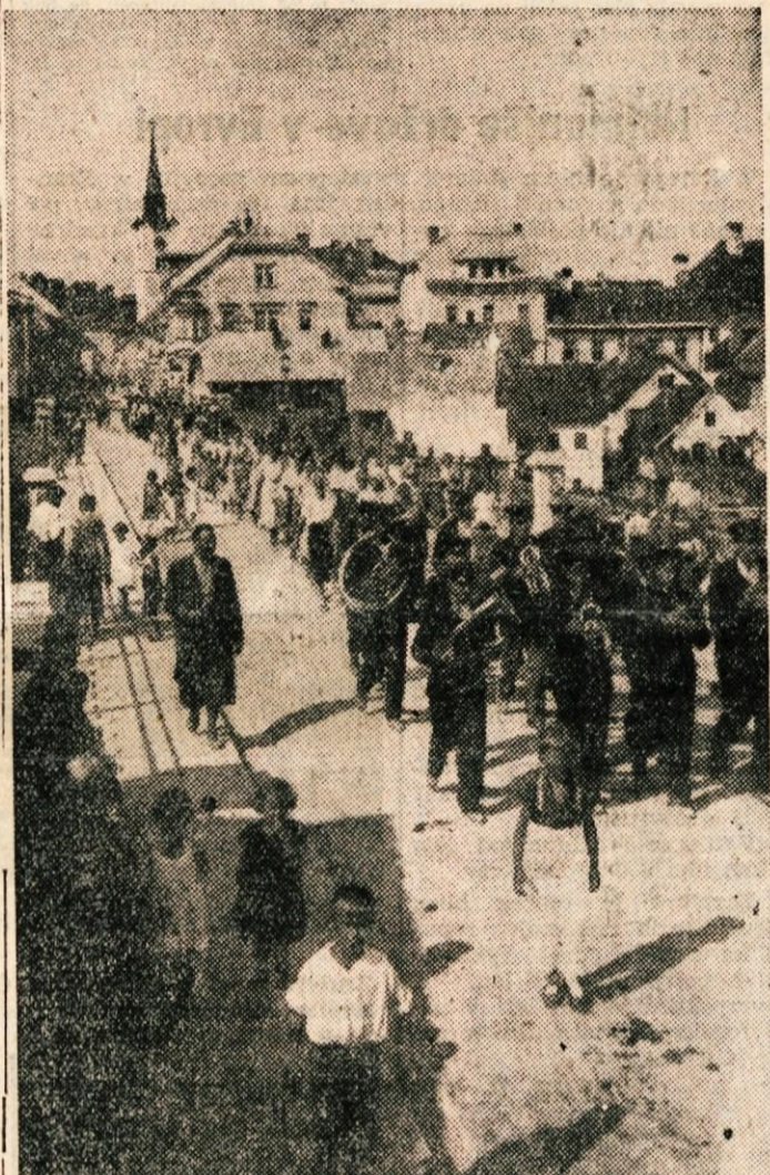
Napredna misel je bila v Beli krajini vedno živa. — Na sliki: Društvo kmečkih fantov in deklet na eni izmed svojih manifestacij v Črnomlju

To zimo je delala cestna služba brezhibno. Zanimivo pa je, da je stari način oranja snega na cestah s konjsko vprego popolnoma izpodrinila motorizacija. V ta namen se poslužujejo v zadnjem času težkih tovornih avtomobilov, na katere pritrjuje na sprednji del snežni plug, ki čisti eno stran ceste v eno smer. Ta način je najhitrejši, zahteva pa dosti tehničnega obvladanja vozila. Poleg kamionov veliko uporabljajo za vlačenje plugov še male vlačilce-goseničarje, katere posodijo proti odškodnini druga podjetja, ki z njimi razpolagajo. Tak goseničar viječe snežni plug s hitrostjo 7 km na uro, če ni sneg predebel, in je mnogo bolj praktičen, cenejši in hitrejši kot konjska vprega.