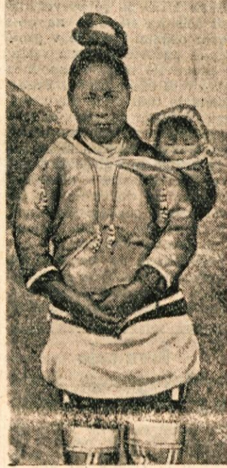
Eskimka z otrokom

Eskimji zahodnega Grönlanda so po postavi najmanjši, dosežejo največ meter in pol. Jih