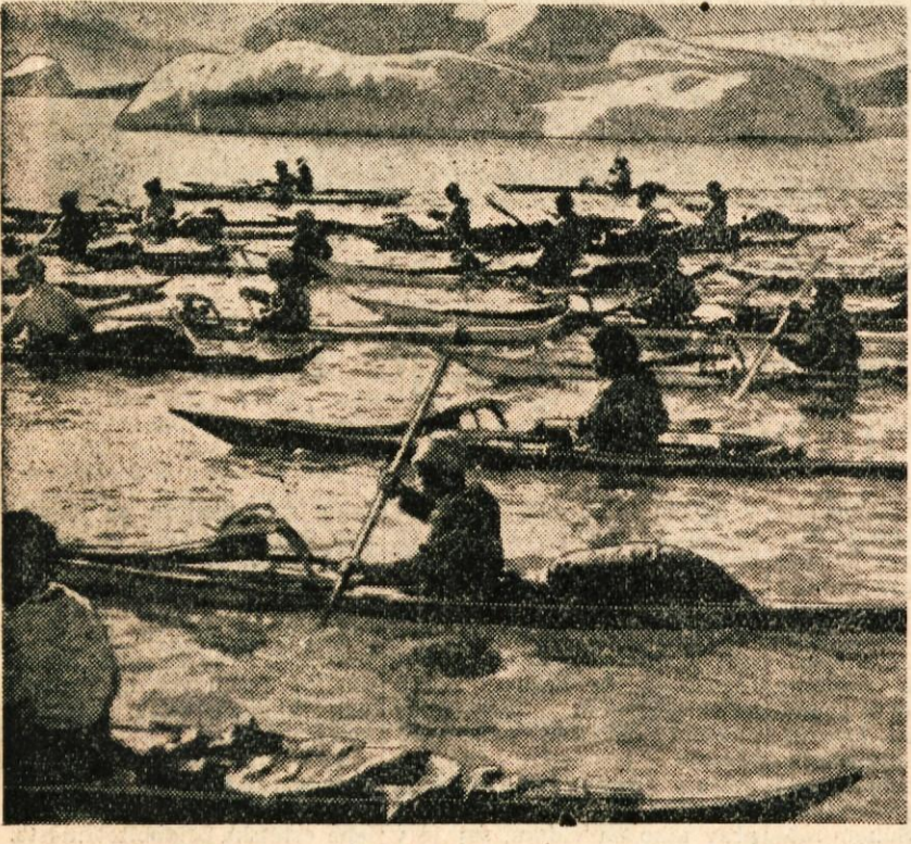
Grönlandski Eskimi v kajakah

je okrog 12.000. Pod vplivom Dancev so se nekoliko kultivirali, so kristjani in protestanti, v bistvu pa še zmeraj čuvajo primitivno vero svojih prednikov v zle duhove. Njih glavno naselje je Godthaab. Eskimji vzhodnega Grönlanda so veliko manj kulturni, kakor oni na zahodni obali. Njih je le nekaj sto in so strnjeni okrog mesteca Angmossolik. Živijo v okroglih šotorih iz ribje kože. Vsak moški ima dve ženi. Otroci, dokler so majhni, so povsem beli, šele kasneje dobijo značilno temnordečkasto barvo Eskimov. To so sploh najnekulturnejši Eskimi, silno zamazani in divji. Hranijo se izključno s fokami in mroži, ki jih lovijo neprestano, dokler ne nastopi dolga polarna noč.