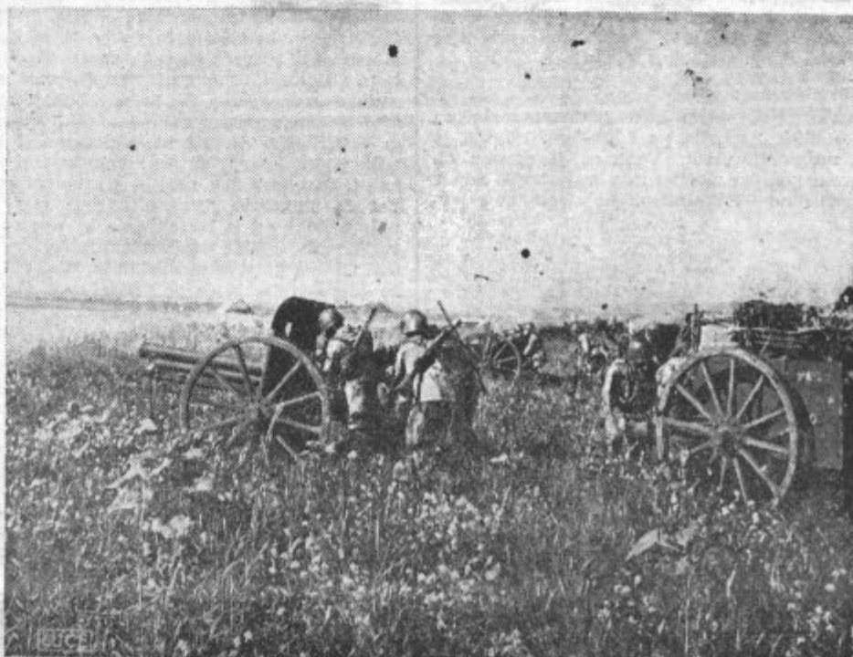
Italijansko topništvo v akciji na Donu

opozarja list na sodelovanje Italije v zdajšnji vojni. Italijanske oborožene sile, piše list, so delovne povsod, kjer se ruši angleški imperij. V Afriki in na Sredozemskem morju so italijanske