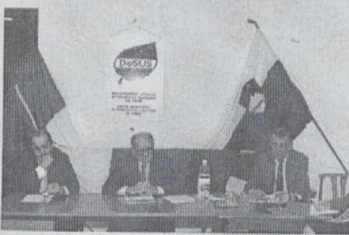
Z volilne konvencije Območne organizacije DeSUS Piran.

Računalniško podprt splošni informacijski turistični sistem, kot ga imamo v informacijski pisarni OKTPS v Portorožu, Obala 16, je namenjen za zbiranje in posredovanje splošnih turističnih podatkov, tako med turističnimi informacijskimi centri (TIC-i), kot neposrednim uporabnikom - turistom.