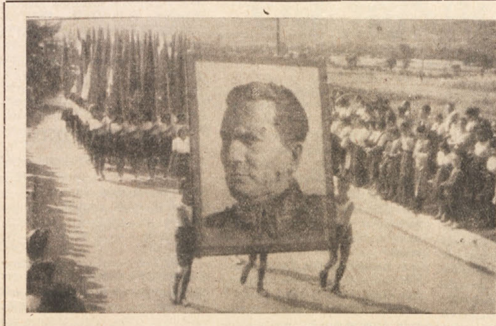
V začetku povorke fizikulturnikov

Ljudstvo Goriške je odneslo s Parade dela v Ajdovščini najbolj prepričevalni in globoki vtis. Zato nestrpno čaka, da bodo tudi ti kraji priključeni Jugoslaviji. Cona B je pod upravo JA. Ob-