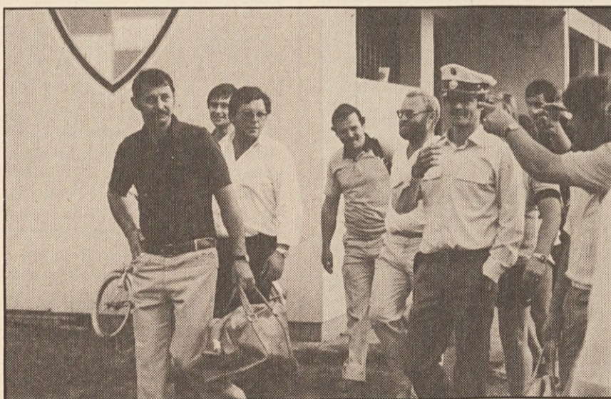
Sodnik Ruch je moral zapustiti igrišče s spremstvom . . .

Od vsega začetka so Šmihelčani napadali vrata vodečega na lestvici iz Labodske doline. Kljub temu pa jim v prvi polovici ni uspelo dati gola. Nasprotno — Št. Andraž je v 30. minuti iz prostega strela dal presenetljivo gol in s tem povedel na 0:1. V drugi polovici je šlo podobno naprej. Šmihel je deloma napadal s šestimi igralci, enajsterica iz Št. Andraža pa je s celotnim moštvom branila svoja vrata. Šmihelčanom pa je končno le uspelo vsaj enkrat zatresti nasprotnikovo mrežo. V 75. minuti je Micheu streljal iz 20. metrov, odbito žogo pa je Vauče „poslal“ v mrežo. Šmihel je imel sicer še nekaj lepих priložnosti za zadetek, toda žoga enostavno ni hotela več v gol. Tekma se je končala za Šmihelčane razočarano 1:1 neodločno. Šmihel igra naslednje kolo v soboto, 3. septembra v St. Leonhardu v Labodski dolini.