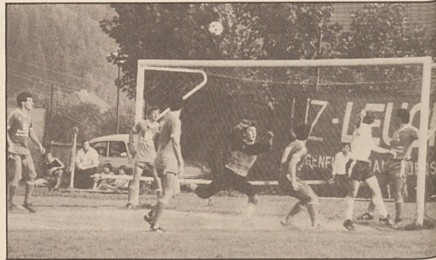
Tudi po 3. kolu so ostali napadalcji SAK „praznih nog“.

... da so Selani tako krepko podpirali svoje moštvo v derbiju, da so se morali v ponedeljek pogovarjati s pomočjo rok.