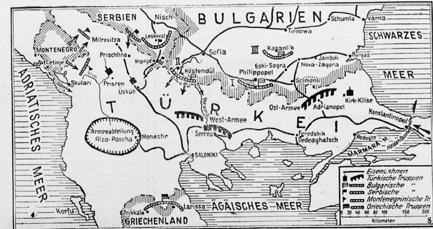
Tukaj podajamo našim čitateljem zemljevid, kjer se vrši krvavi boj. Zgoraj na skrajni levi je Črnogora, na sredi Srbija, na desni Bolgarija, spodaj je Grška. V sredini pa je Turčija. Žal, da se ne more dobiti slovenskega zemljevida. A kdor je le količka večš nemščine si bo že znal pomagati s tem zemljevidom.

Grška armada je 21. t. m. po štiriurnem boju zavzela Elasono ter pritiskala Turke proti Sardanoporonu. Tam se nahajajo grške zasede, v katerih se koncentrirajo vse severno grške prebival-