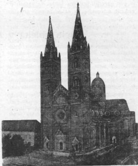
Stolna cerkev v Đakovem.

ter pri drugih primernih slavnostih? Kam so šli tisti mladi branitelji ter vojaki Ma- rijini, se vedno povprašujemo? Mnogo mного jih je telesno umorila kruta ne- sramna vojska, ali zdi se mi, da še več pa jih je vojska duševno zamorila.