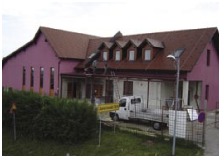
Zaključna dela na kulturni dvorani