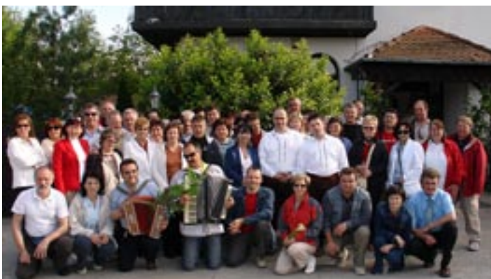
V Novem Sadu

vožnja proti domu. Naj omenim zanimivost, da v mestu Beograd živi 1,6 milijona prebivalcev, od katerih je večina pravoslavcev in katolikov, muslimanov je le za odstotek. Najvišja beograjska vrhova sta Avala (511 metrov) in Kosmaj (628 metrov). Ime Avala izhaja iz turške besede »haval«, kar pomeni ubraniti se. Za Atenami je Beograd drugo največje mesto na Balkanu, zato mu med drugim pravijo tudi »srce jugonostalgije«.