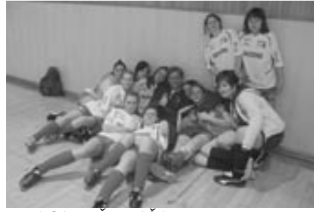
ZMAGA JE ŽE NAŠA