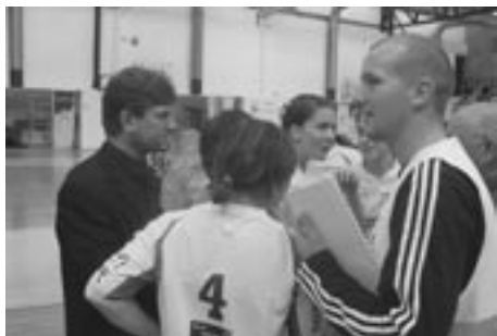
KRIZNEMU ŠTABU NI BILO TREBA ZASEDATI