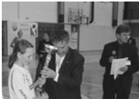
IZ ROK PRVAKA V ROKE PRVAKINJAM