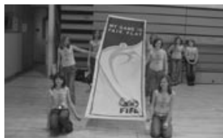
PO NAČELIH FAIR PLAYA DO NOVIH ZMAG