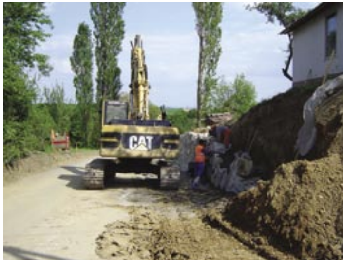
Dela na državni cesti proti centru Destrnika se nadaljujejo

Občan: Kako ocenjujete delo v letih, v katerih ste županovali in v katerih je bilo zaključenih veliko pro-