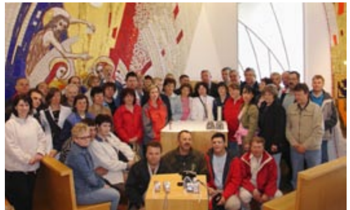
V kapeli pri slovenskem nadškofu v Beogradu Stanislavu Hočevarju

srce Šumadije - mesto se je nekoč hrabro upiralo turškim krvnikom in bilo celo središče upora. Vožnja so nadaljevali v Ople-