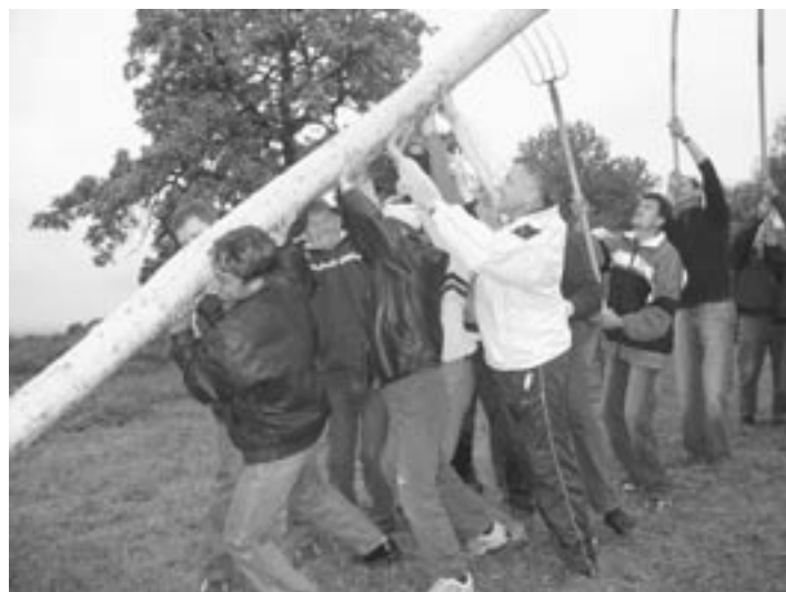
Občan - 26. maj 2006

Tekst: Venčeslav Kramberger