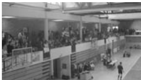
BARCELONINI NAVIJAČI SE LAHKO SKRIJEJO