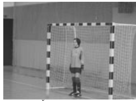
PA DAJTE ŽE TOTI PRESNETI GOL