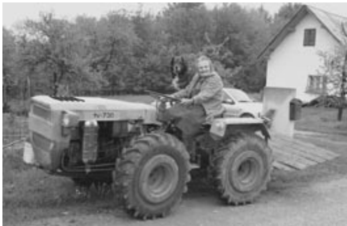
Občan - 26. maj 2006