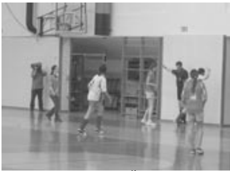
SODNIK, SI VIDO KI ŽOGO???