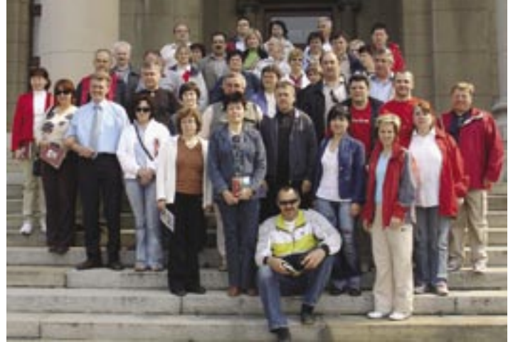
Pred nekdanjo zvezno skupščino SFRJ in današnjo zvezno skupščino Srbije in Črne gore