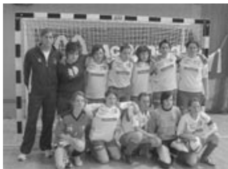
ŠAMPIONI PO GASILSKO