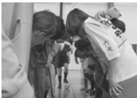
SODNIK, PAZI SE! VIDIMO TE!