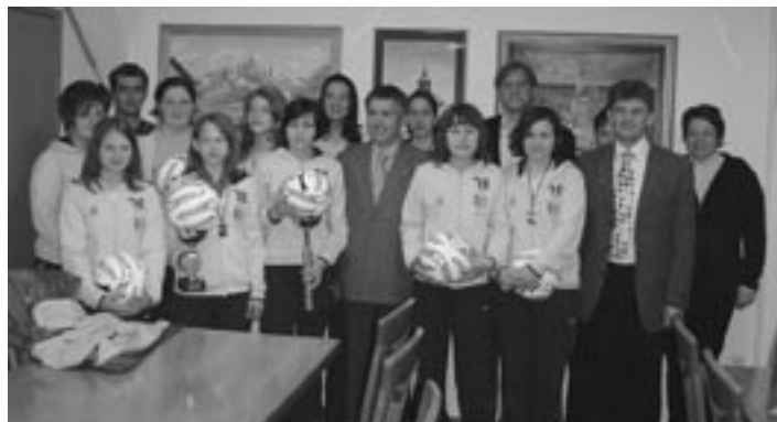
Gasilski posnetek s sprejema v sejni sobi