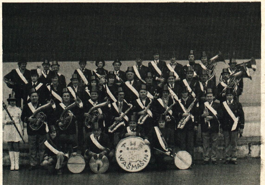
Litijska godba — posnetek je z letošnjega karnevala, na katerem godba redno sodeluje