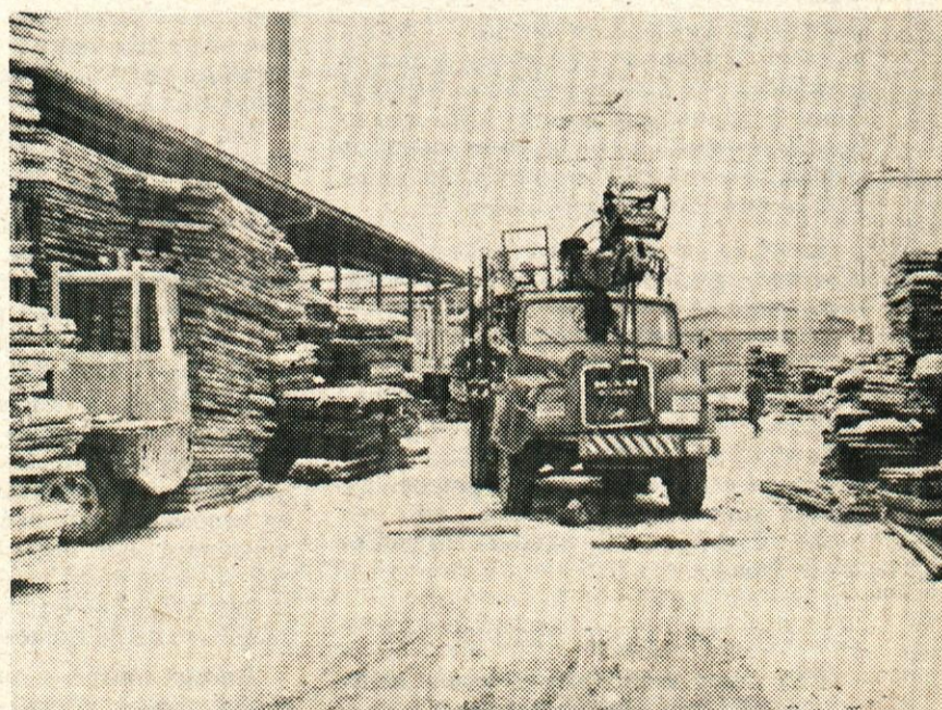
Nepazljivost - k sreči je bila samo materialna škoda