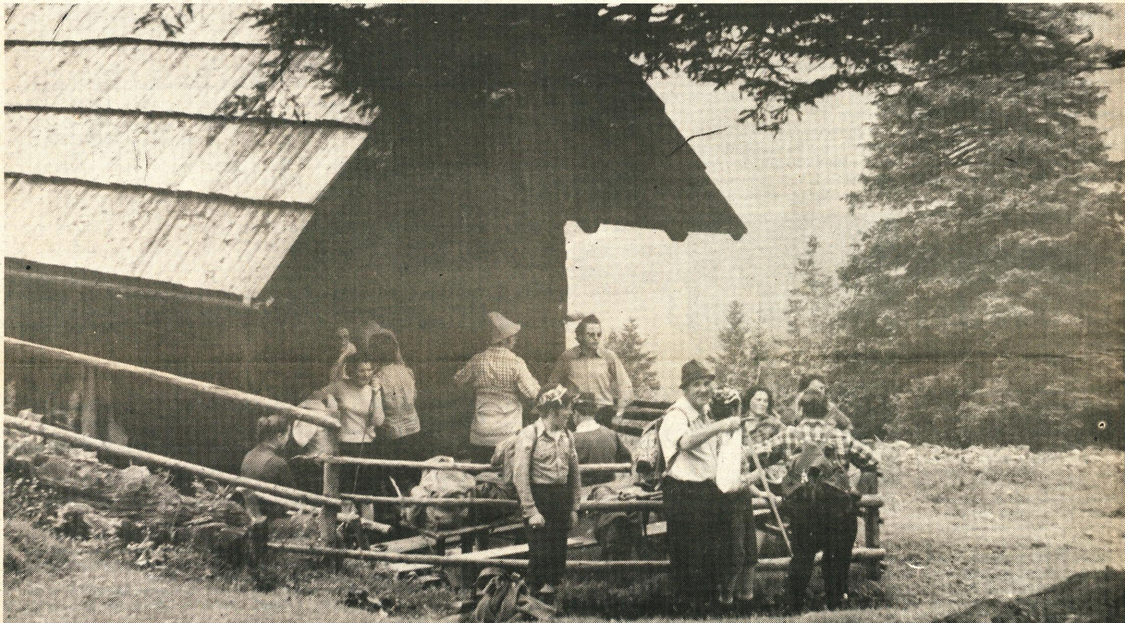
Z enega izmed izletov PD Litija – počitek pri planšarski koči na Mali Poljani