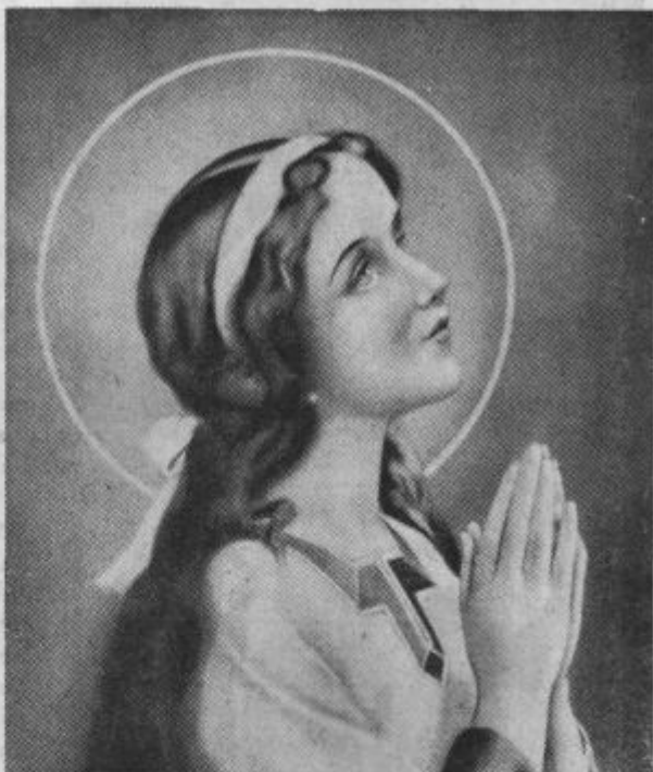
K soprazniku Marijinega darovanja, 21. november.

Naj le presodi vse take pomisleke, kdor koli stopa na apostolsko pot, ker bo potreboval pri težkem delu trdne in