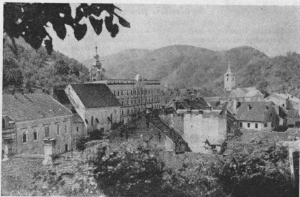
Slavonska Požega z nadškofijskim konviktom. (Začasno zbirališče slovenskih duhovnikov.)