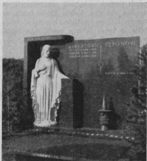
Nagrobni spomenik: Čepon-Žibert.

Misel na smrt naj nas ne potare, ampak dviga in bodri, da se trudimo za večne dobrine. »Delajte, dokler je dan; pride noč, ko ne more nihče več delati« — nas opominja Kristus sam.