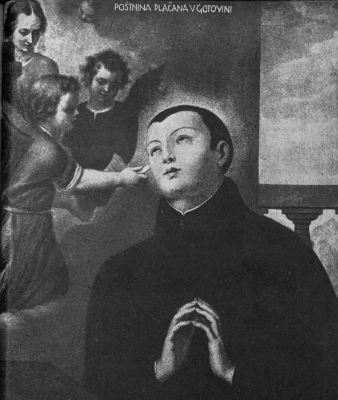
Sv. Stanislav Kostka. (Rim: Soba, kjer je svetnik umrl.) God: 13. nov.