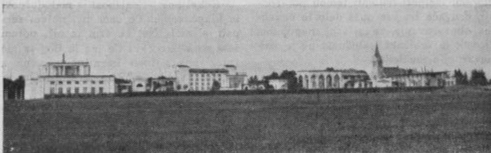
Žale. (Zadnja postaja Ljubljančanov pred pokopom.)

»Nič čudnega! Samo da je led prebit, potem pa gre. Vse urejeno: Cerkev in oltarji, orgle in pokopališče, tudi steze in pota na pokopališču in pota do cerkve in okoli cerkve! Može! Potem boste tu-