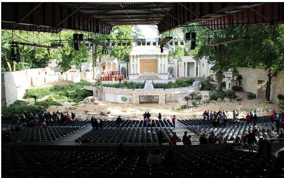
Pogled z vrha gledališča De Doolhof proti kulisi svetopisemskega Jeruzalema.