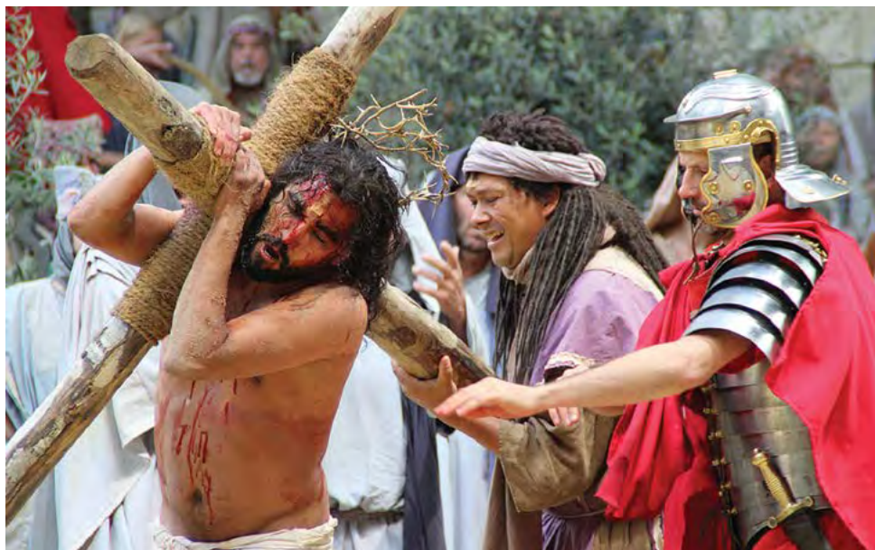
Simon iz Cirene pomaga Kristusu nositi križ.