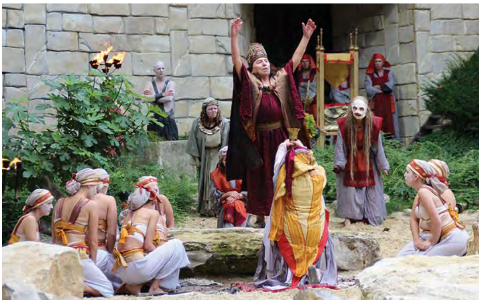
Igralec, ki upodablja kralja Heroda, igra v pasijonu kljub visoki starosti 86 let.