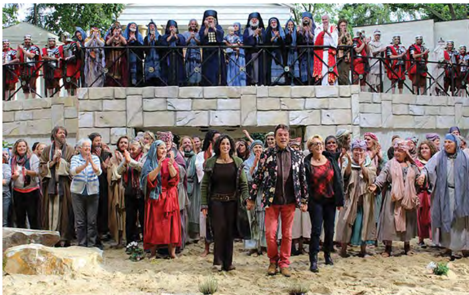
Končni aplavz, namenjen igralcem, režiserjem, kostumografom in drugim sodelujočim, je kar trajal in trajal.