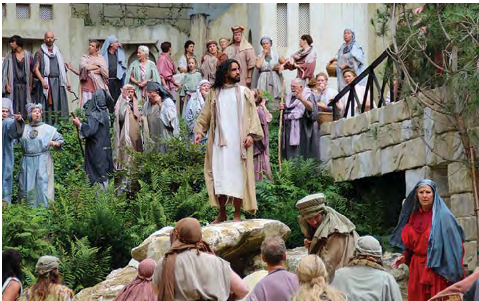
Kristus nagovarja množico.