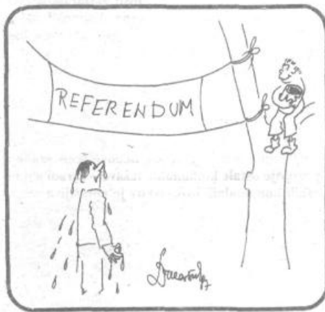
Na območju KS Pijava Gorica je okrog 800 lastnikov počitniških objektov in parcel, predvidenih za gradnjo, ki

Najbrž ste uganili spoštovani bralci, da so na novozgrajenem posnetku fotografije individualne gradnje v novem viškem naselju na Grbi. Skupno bo zgrajenih 178 stanovanj, prvih 70 pa bo vseljivih že to poletje. Kot zanimivost v nizu A3 je cena kvadratnega metra stanovanjske površine 400.622 oziroma končna 477.000 dinarjev, v nizu B3 pa 427.386 oziroma 509.000 dinarjev. Vsa stanovanja v teh hišah so baje prodana.