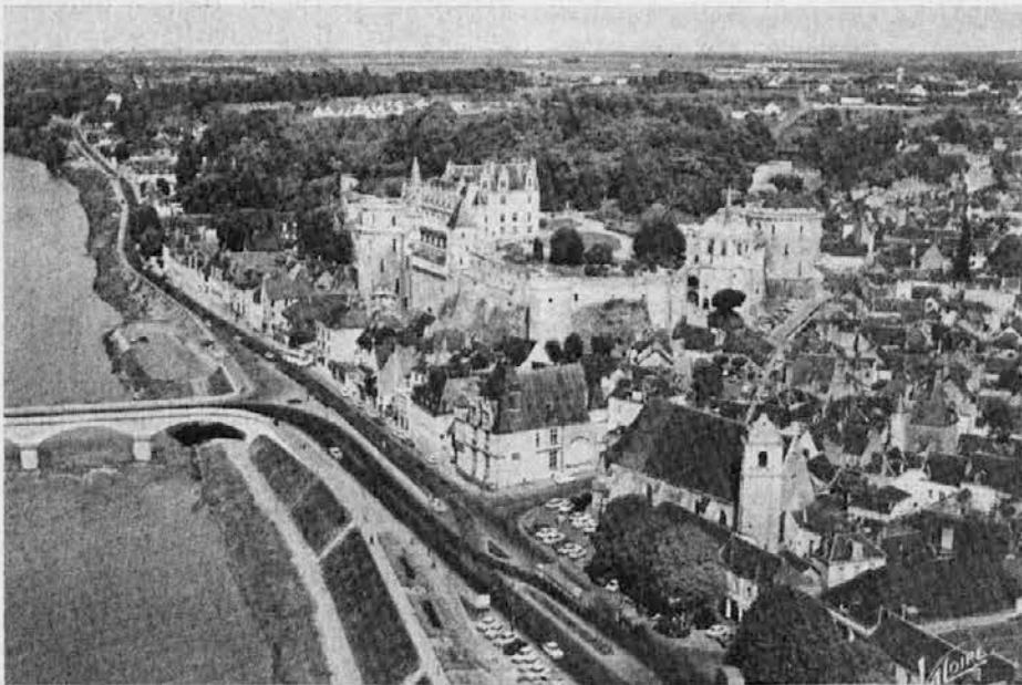
Grad Amboise z mostom prek reke Loire

K šagri sv. Roka spada tudi tradicionalno tekmovalje v pritrkovanju, ki se ga je udeležilo 15 skupin, zvečine z onstran meje. Te so si tudi pridobile prva mesta in sicer iz Budanj, Podnanosa in Ajdovščine.