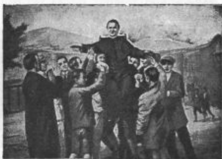
Don Boska njegovi dečki nosijo.