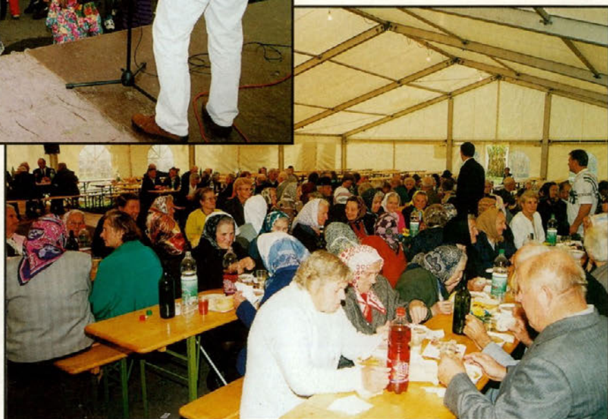
Vsakoletna srečanja starejših občanov se je letos udeležilo več kot 300 naših občanov.