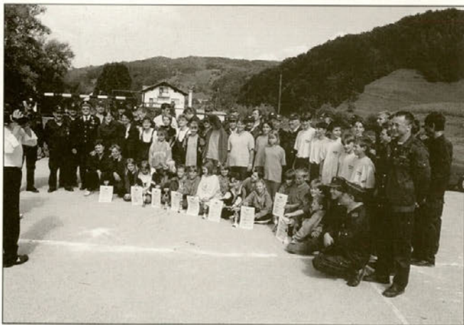
Med številnimi gasilskimi spretnostmi so se celostno najbolj odrezali majšperški gasilci.

Sobotno dogajanje, 19. septembra se je začelo z občinskim gasilskim tekmovanjem v Stopercah. Udeležilo se ga je kar 24 gasilskih desetov oziroma več kot 300 gasilk in gasilcev. Med člani A je bila najboljša gasilska deseterina Majšperk–Breg, med člani B domači stoperški gasilci, med veterani Majšperčani, med članicami A prav tako gasilke iz Majšperka in med članicami B domačinke – gasilke iz Stoperc. V gasilskih veščinah in znanju so se pomerili tudi pionirji. Najbolj spretni so bili pionirji iz Žetal, med pionirkami, mladinkami in mladinci pa Majšperčani niso imeli prave konkurence.