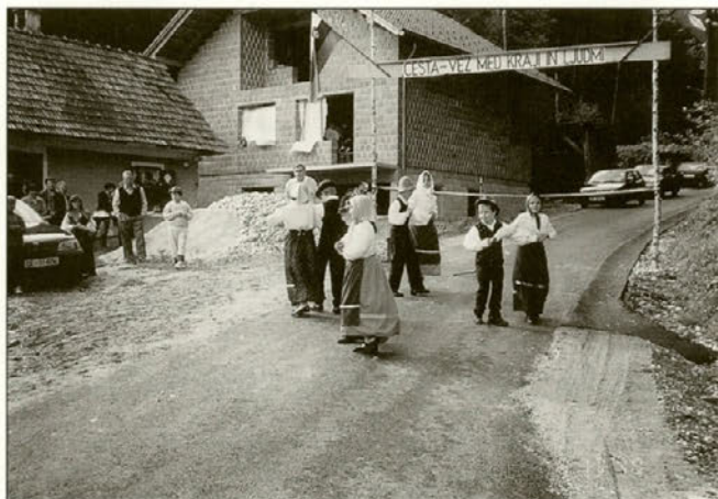
Vesetje ob na novo odprti cesti so z ljudskimi plesi popestrili tudi naši najmlajši krajan.

Popoldne ob 16.00 uri so s krajšim kulturnim programom obeležili otvoritev ceste Ptujška Gora–Doklece. Gre za 1100 metrov dolg odsek, vrednost investicije pa je ocenjena na 10.587.499 tolarjev. Delež, ki so ga po pogodbah zbrali občani sami znaša 4.324.000 tolarjev. Pripravljalna dela je opravilo podjetje TAMPON, asfalt pa je položilo Cestno podjetje Ptuj. Svečanost so na sami slovesnosti popestrili najmlajši, ki so se predstavili z ljudskimi plesi.