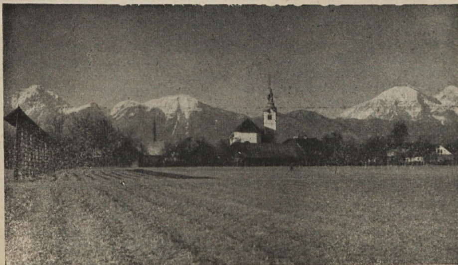
Šenčur pri Kranju na Gorenjskem.