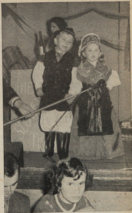
Mlada Slovenca pojeta na vseslovenski prireditvi oziroma trgatevi.

Čez 250 rojakov se je okoli polnoči vračalo na svoje domove, govoreč: „Na tako prireditev bomo pa še prišli!“ — Naša mladina pa: „Res, lepe so naše slovenske navade, zato hočemo tudi mi ohranjati to našo dediščino v tujini!“ — le škoda, da zaradi prepovedi vožnje z avtomobili niso mogli priti še bližnji Eysdenčani; pravijo, da je bilo en avtobus fantov. Tako so si vsaj naša dekleta ohranila cele pete na čevljih. — Pa drugič na svidenje! Morda na Martinovo nedeljo v letošnjem letu?!