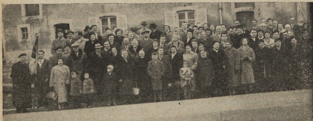
Slovinci, zbrani v Aumetzu (Francija) pred tamkajšnjim prosvetnim domom, z zastavo bivšega Jug. kat. rudarskega društva v tamkajšnjem kraju in s svojim izseljenskim duhovnikom.

V Aumetzu, so nas naši Aumetčani z veseljem ne samo sprejeli, ampak tudi kot brate in sestre povabili v bivši prosvetni dom, postregli s kavo, potico, sirom. — Vse je bilo tako lepo organizirano, da smo se čudili plemenitosti, darežljivosti in pridnosti naših rojakov, skoro 100 km oddaljenih od nas. Zvonovi so nas povabili v cerkev, kjer se je zbralo na stotine vernikov raznih narodnosti. Francoski dekan — zlata duša — silno vesel, je zapel s svojimi francoske pesmi. Nato je dal besedo nam Slovincem, ki smo imeli brez pretiravanja čez 300 ljudi v cerkvi. Škoda, da ni bil kor še končan. Zato so morali naši pevci peti ob stranski steni med množico ljudi. Po krat-