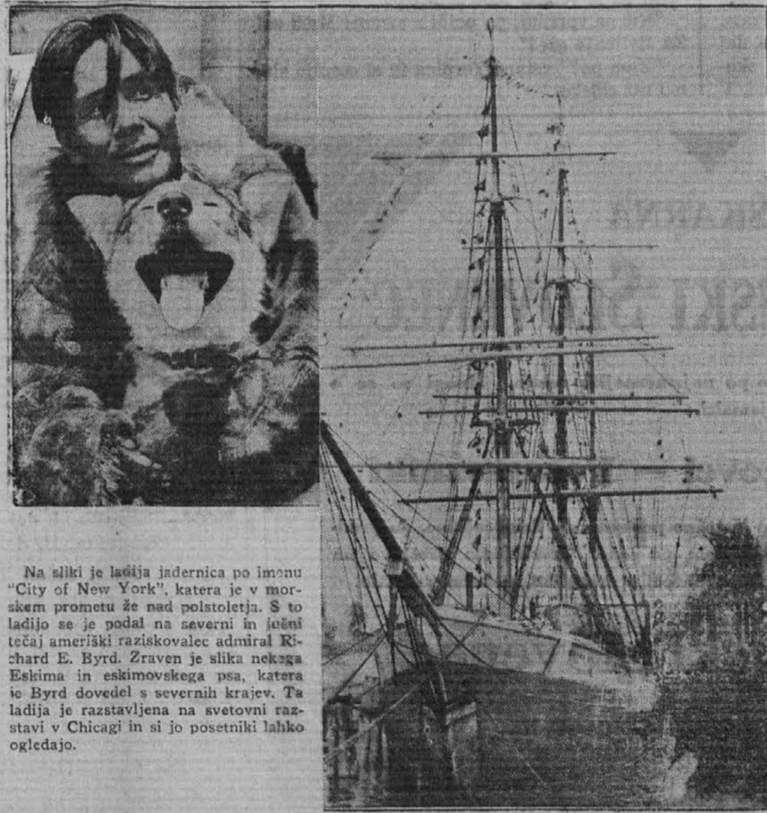
Na silki je lažja jadernica po imenu "City of New York", katere je v morskem prometu že nad polstoletje. S to ladjo se je podal na severni in južni tečaj ameriški raziskovalec admiral Richard E. Byrd. Zraven je slika nekoga Eskima in eskimovskega psa, katere je Byrd dovedel s severnih krajev. Ta ladja je razstavljena na svetovnih razstavi v Chicagi in si jo posetniki lahko ogledajo.