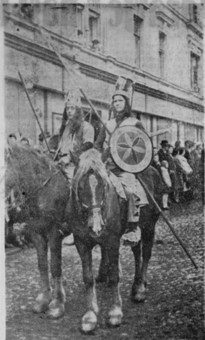
Indijanci iz Dornave

Na žalost moramo priznati, da naš karneval sploh ne bi bil uspel, če ne bi bila sodelovala tudi ugledna podjetja Merkur, Panonija, tekstilna tovarna Metka in če ne bi bili v povorki obe že dvakrat nastopajoči skupini iz Velike Nedelje in z Brega. Tudi ti dve skupini sta z iniciativnostjo in požrtvovalnostjo prikazali aktualno temo. Ob sklepu te bežne analize kurentovanja in karnevala prosimo vse, ki bi imeli koristne predloge v zvezi z vprašanjem nadaljnega razvoja našega kurentovanja in karnevala, da jih pošljejo pismeno na naslov: Ptuj, Muzejski trg 1, ali uredništvo »Tednika«. Drago Hasl