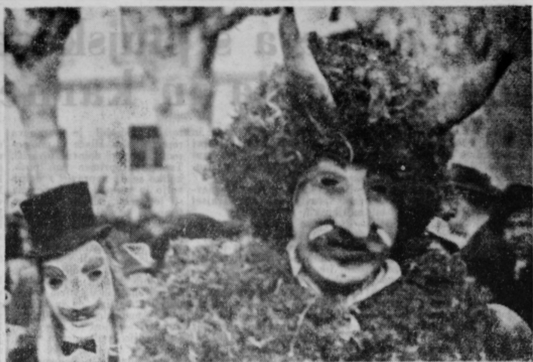
Cerkljanski »laufarje« na pohodu po Ptuj 4. marca 1962

Pisateljica Marija Krukowska je ob obisku v Jugoslavijo občudovala naše kraje in se je tudi navdušila za sodobna književna dela naših avtorjev. Potrčev roman »Na kmetih« je eden izmed prevodov naših knjižnih del v poljski jezik in lahko verjamejo, da bodo po njem radi segali bralci sodobnih knjig na Poljskem. VJ.