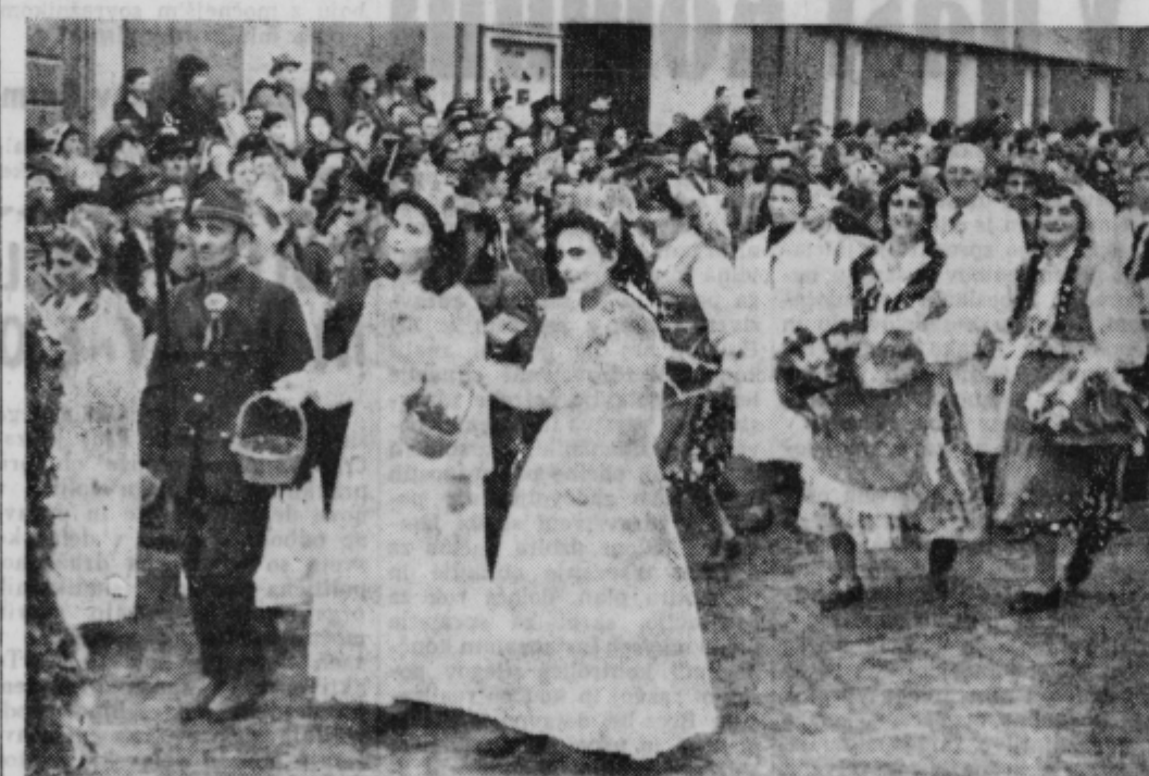
Pust je minil. Svatje »borovega« gostovanja pa bodo ostali sem v lepem spominu

Ob 8. marcu je bilo sinoči v Beogradu srečanje predstavnic jugoslovanskih žena s tujimi študentkami, ki študirajo na beograjski univerzi.