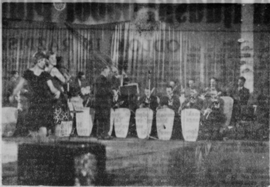
Dvorana v Kidričevem ob RTV oddaji