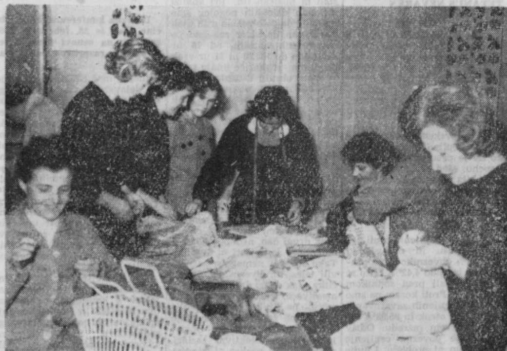
V večernih urah se žene in dekleta rade udeležujejo raznih tečajev

ven bolnišnice. Razbremenitev dosegamo s honorarnimi zaposlenimi (Nadaljevanje na 2. strani)