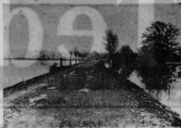
Večkrat poškodovana cesta pri Mostju

Zavod za vzdrževanje občinskih cest Ptuj, ki je bil lani ustanovljen, je prevzel vzdrževanje 268 km občinskih cest in mostov po območju krajevnih uradov.