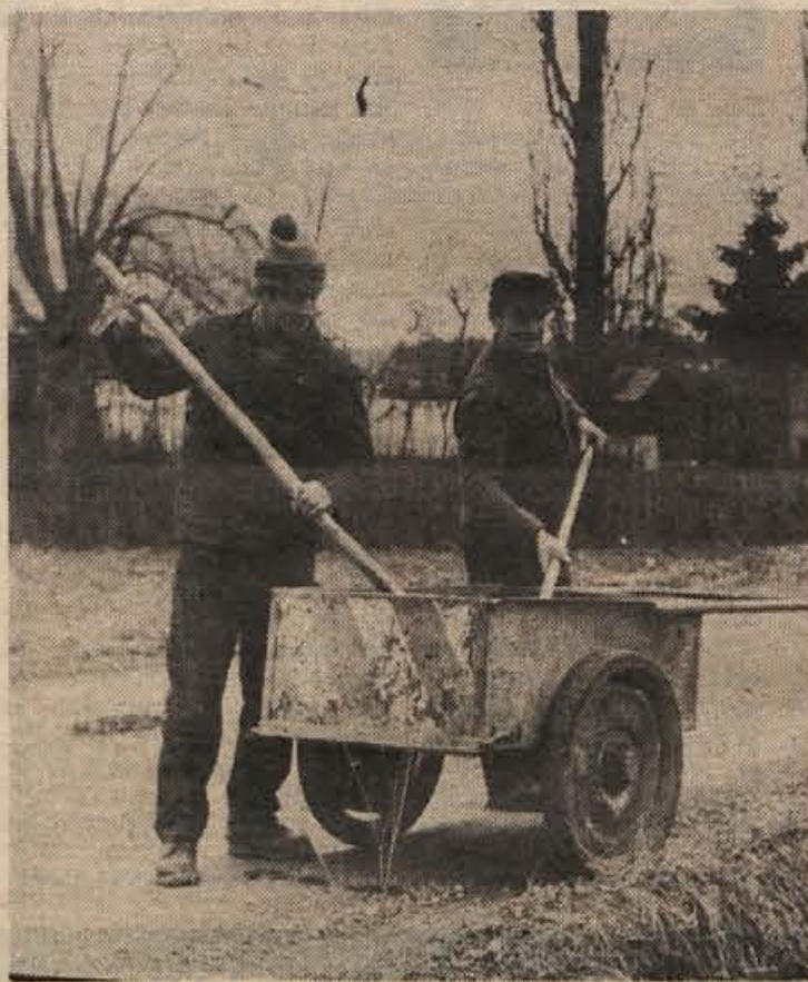
Cesta iz Brežic do Krškega je zelo prometna tudi po štajerski strani. Na makadamskem odseku skozi Dolenjo vas cestarja komaj sproti krpata luknje, zato ni čudno, če se tudi onadva veselita obetov za skorajšnje asfaltiranje.