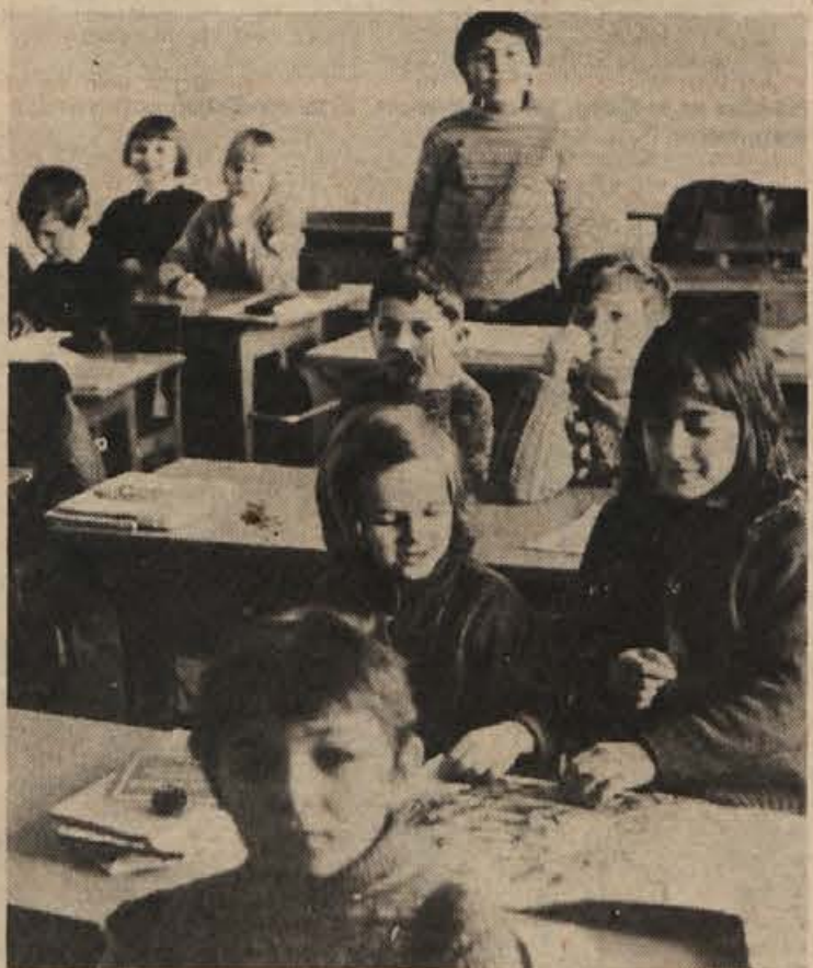
1. d razred je na črnomaljski šoli po uspehu eden najboljših, čeprav je v njem tudi 5. Cigančkov

Dolenjski in Karloški oktet sta se za sodelovanje začela pogovarjati ob gostovanju Novomeščanov na proslavi slovenskega kulturno-prosvetnega društva v Karlovcu pred dvema letoma. Novomeščani so v mesto ob Korani zatem potovali še nekajkrat. Nedavno sta se okteta dogovorila za skupni koncert: 24. marca v novomeškem Domu kulture.