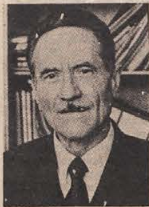
— Bi lahko rekli še besedo, dve o dosedanjih nastopih, naštrukanem sporedu, načrtih?

— Da, naš zbor je pisan in v poprečno ne prestar. Dvakrat na teden imamo vaje, zvečer. To bi morali videti, s kakšnim veseljem pridejo: s košnje, oranja, iz vinograda in zdaj pozimi iz gozda. Delavci večkrat pridejo kar z delovnega mesta. Seveda se to pri petju pozna: utrujen, zadihan pevec težko spravi glas iz sebe, ki ga poje v zboru. Vendar vztrajajo.