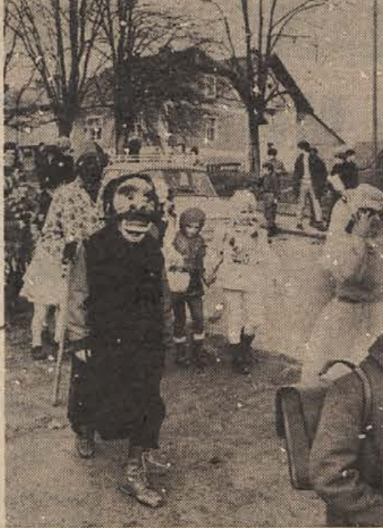
Po Metliki se je na pustni torek vil sprevod malih maskar. Tale volkodlak je bil najbolj strašljiv, sicer pa je bilo med maskarami več ljubkih likov. Celo Pika Nogavička, kot bi bila resnična, se je ta dan sprehajala po mestu.