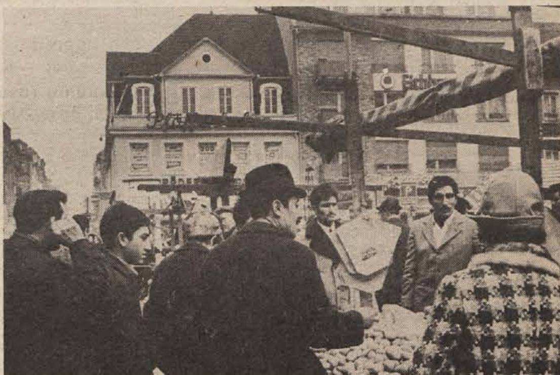
V soboto dopoldne na velikem živilskem trgu v Mannheimu: med skoraj redkimi domačini prevladujejo ta dan »kupci z juga« — zdaj je priložnost, da se za prihodnji teden oskrbijo s krompirjem, solato, karfijolo, ohrovtom in z drugo zelenjavo, tu pa gre odlično v prodajo tudi koštrunovo in jagnječje meso. Na trgu dobiš zelenjavo in sadje vseh vrst iz Španije, Italije, Grčije in seveda tudi iz dežel skupnega evropskega trga ...

A nič zato: kar sem videl, slišal, zapisal in razmišljal v drugi polovici letošnjega januarja med rojaki, znanci in prijatelji na Nemškem, bo dovolj, da bom v nadaljevanjih lahko predstavil