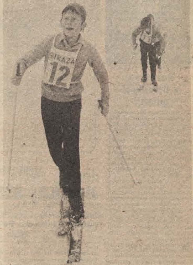
Tekačem je delal največ preglavic moker sneg; sem in tja so morali teči tudi po travi. Vendar jih to ni motilo, saj so se hitro vziveli v razmere.