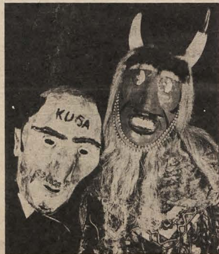
„MAŠKARI“ – Tale par maskar je na pustni torek zbuja v Kočevju in Ribnici veliko pozornost. Dva metra in pol velika maskara z rogovi ter „kuga“ z debelo glavo kot čeber sta se le z veliko težavo prerivali skozi ozka vrata lokalov. (Nagrada 100 dinarjev.)