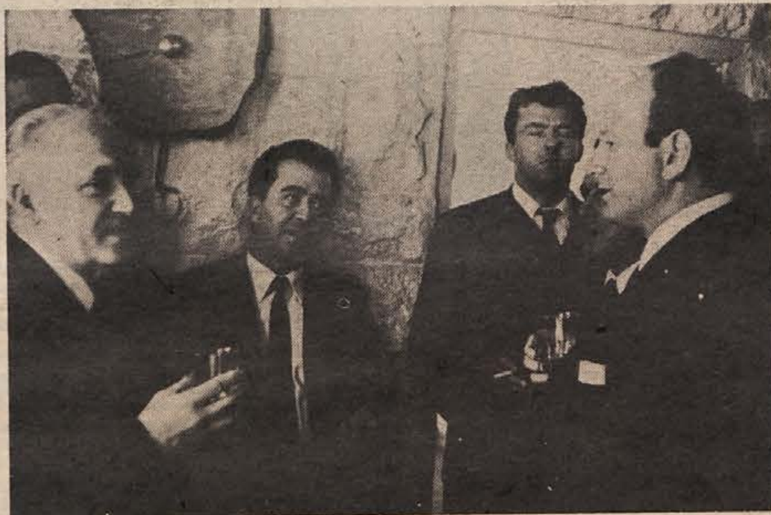
Edini prosti trenutki predsednika Sergeja Kraigherja (na levi) med nedavnim obiskom na Kočevskem so bili tisti pred kosilom v novem gostišču KGP Kočevje v Glažuti. Razgovori predsednika s kočevskim političnim aktivom in gospodarstveniki – ki jih je RTV še tisti večer (15. februarja) proglasila za kratke – so trajali skoraj neprekinjeno od 9. ure do 20.30. Le kakšni so potem dolgi pogovori oziroma sestanki?