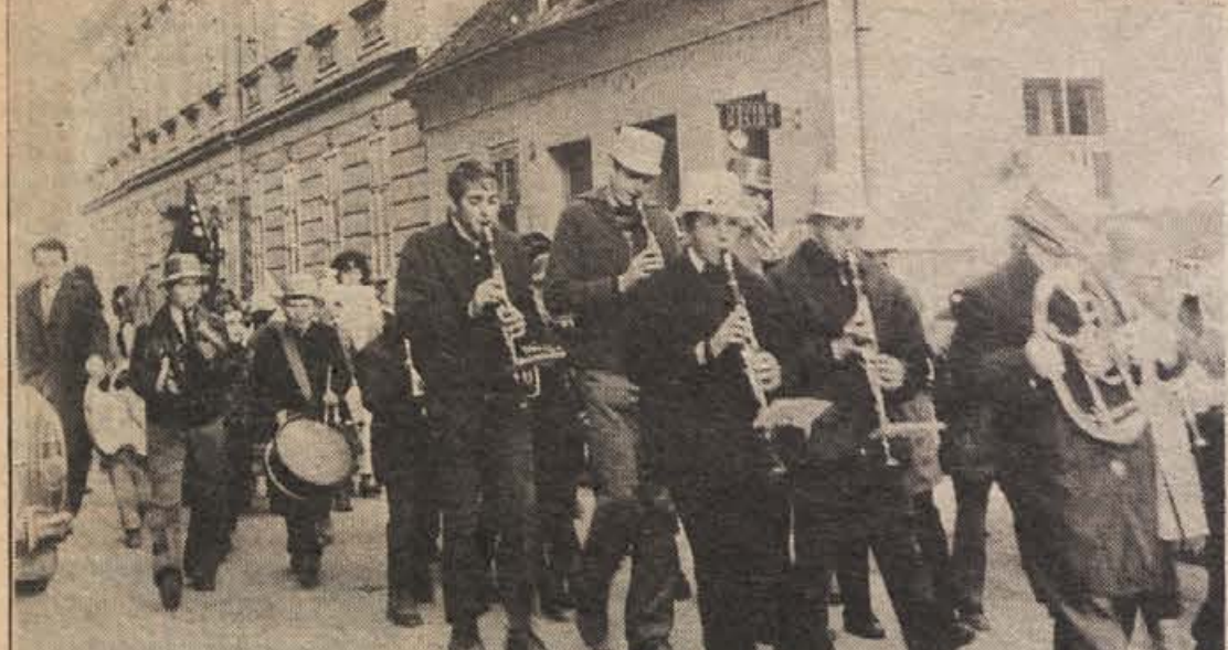
Učenci pihalnega oddelka pri glasbeni šoli v Brežicah so na pustni torek igrali na otroškem karnevalu. To je bil njihov prvi javni nastop. Ta skupina tvori jedro mladiške godbe na pihalah, ki jo ustanovljajo. Pozivu k sodelovanju v godbi se je odzvalo že precej otrok iz višjih razredov osnovne šole.