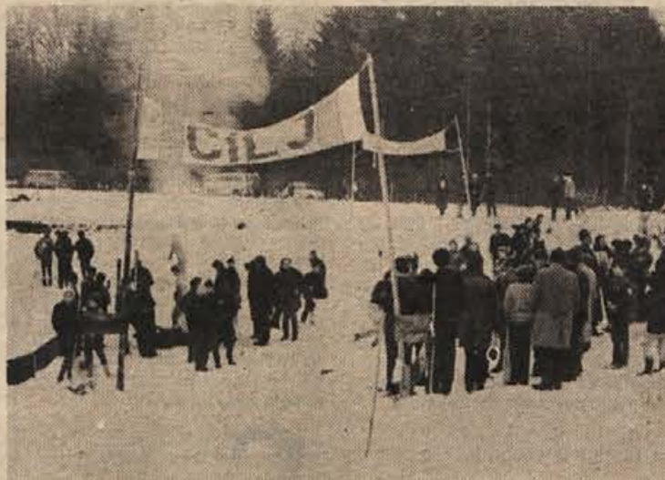
Na cilju se je zbralo precej gledalcev, ki so spodbujali požrtvovalne tekmovalce.