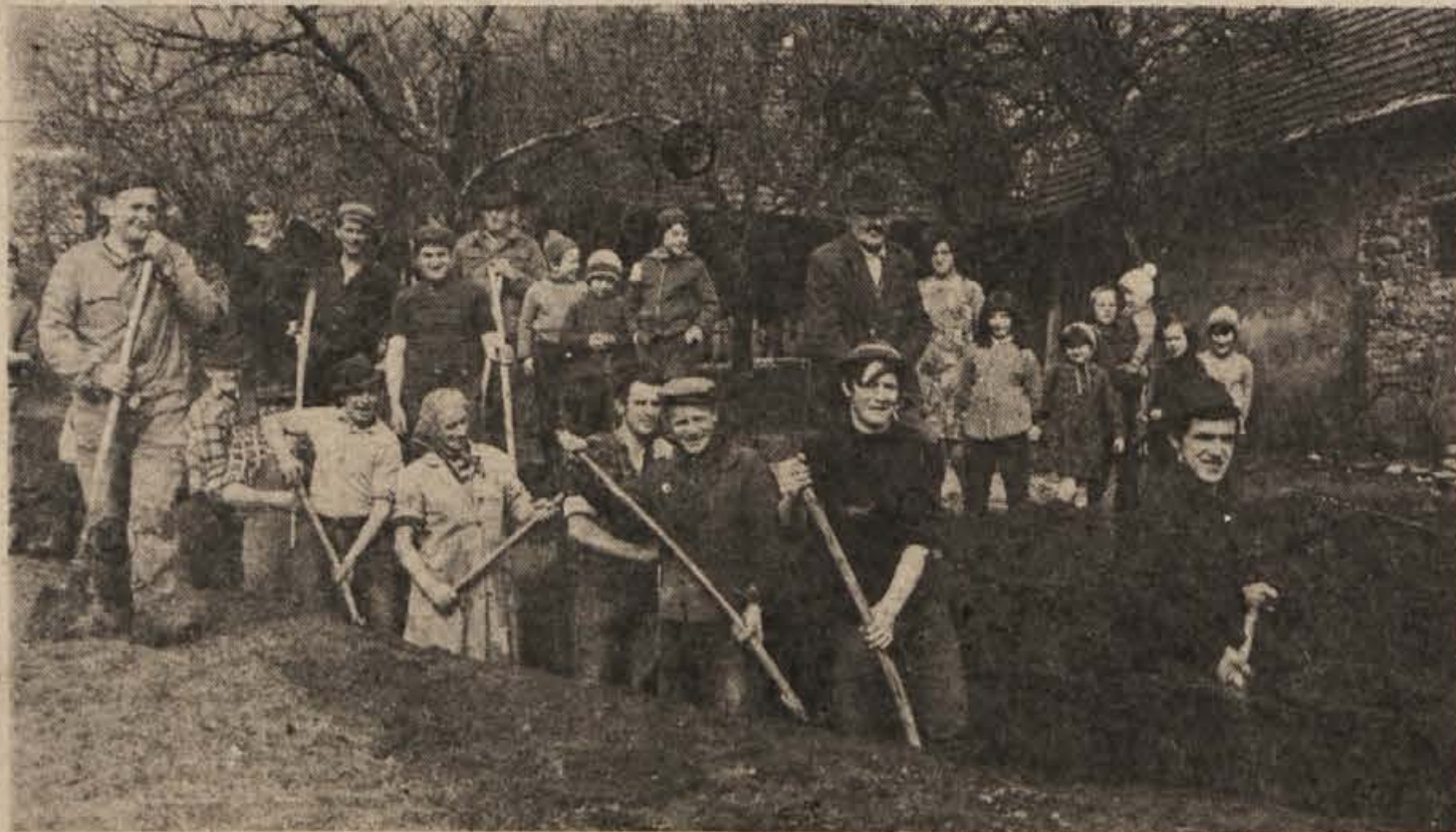
„DELOVNA AKCIJA“ – Vaščani Biške vasi pri Mirni peči so se v nedeljo, 20. februarja, zbrali na delovni akciji, kopali so jarke za vaški vodovod – slika desno.