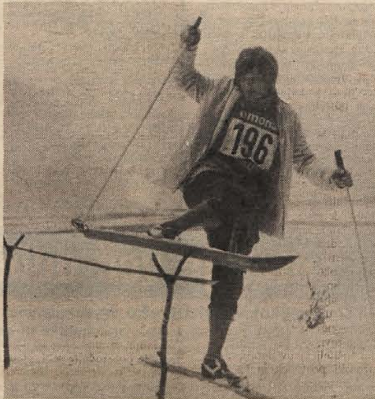
Ho – ruk, ali bo šlo? To je ena najlažjih ovir, ki so jih tekmovalci premagovali kot za šalo. Tudi tej pionirki se je poskus posrečil že v prvem zamahu.