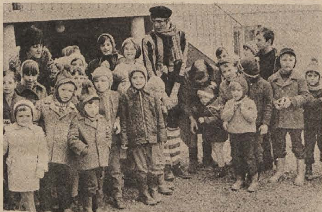
Po predstavi so se številni otroci le s težavo poslovili od Tonija, ki jih je prijetno zabaval po predvajanih diafilmih.

varovanja. Če bomo te podatke zvedeli, jih bomo objavili. ANDREJ ARKO, Kočevo