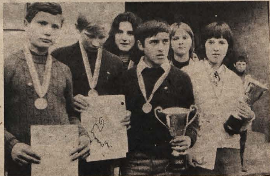
Pionirji in pionirke iz Vavte vasi, ki so osvojili 19. februarja na III. republiškem srečanju pionirjev v orientacijskem pohodu v Vavti vasi prvo mesto. Več o tekmovanju berite na 9. strani.