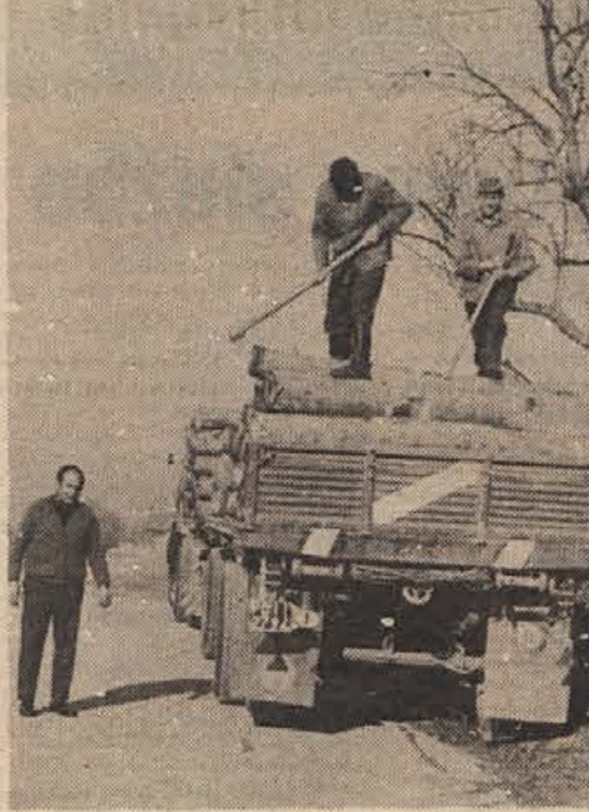
Sami tega ne znamo? 1800 kubičnih metrov bukovega jamskega lesa je z gozdnega obrata v Mokronogu lani speljal kupec iz Padove in z njim dal zaposlitev 350 italijanskim družinam, ki iz tega lesa delajo lesene zabojčke za zelenjavo in sadje.