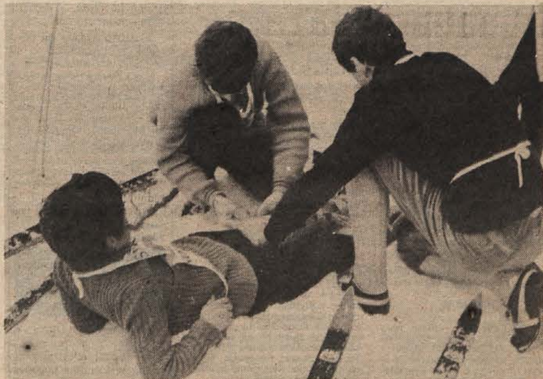
Večina tekmovalec bi znala pomagati ponesrečenemu tovarišu, zlom noge zanje ni bil pretežka naloga. Tudi temu „nesrečniku“ so kar spretno in hitro nudili pomoč.