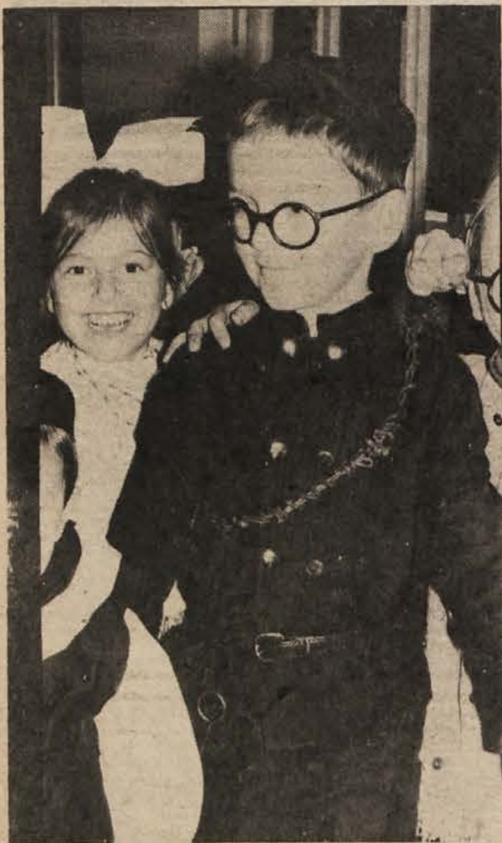
„V ZNAMENJU PUSTA“ – Iz sprevoda pustnik mask, ki je bil na pustni torek v osnovni šoli „Katja Rupena“ v Novem mestu, so člani fotokrožka na šoli izbrali tale posnetek – zgoraj.