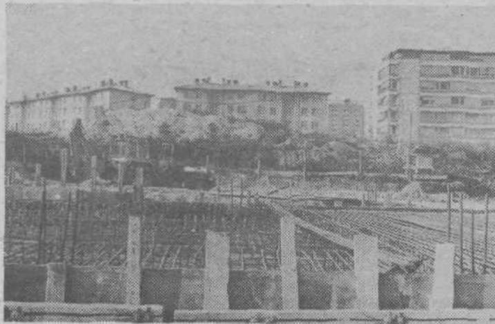
Temelji za VVZ so postavljeni