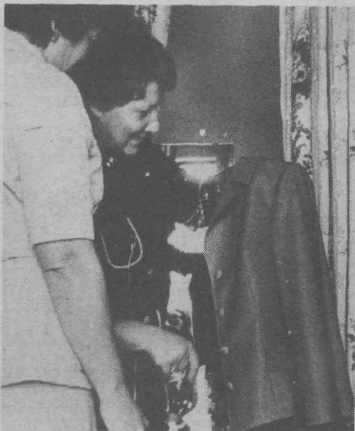
Takole ste želeli, kajne?

Poglejmo nekaj podatkov, ki veljajo za konec junija letošnjega leta. Obrtna dejavnost v naši občini temelji na zasebnem sektorju. Registriranih imamo 633 obrtnikov, ki ustvarijo letno okrog 312 milijonov dinarjev prometa. Izdelan imamo zaidalni načrt za soosko MM 4, kjer naj bi bilo 50 lokacij, namenjenih malemu gospodarstvu in štiri družbeni obrti. Prišlo pa je do zastojev v izdelavi delilnega načrta, zelo dolgi so tudi razlastitveni postopki, tako da bo do gradnje te cone prišlo šele v naslednjem srednjeročnem obdobju.