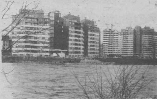
... in danes