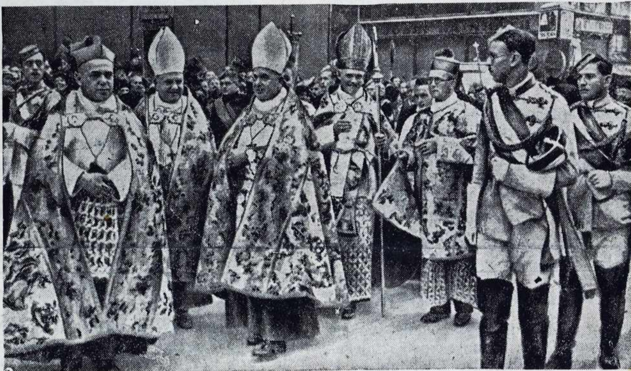
Te dni so slovesno vpelali novoga nadškofa Innitzera v Beči. Slika kaže, kak dijaki v svečanih oblačilaj sprevajajo novoga püšpeka v stolno cerkev sv. Štefana.

Mladina ne sprevidi, ka si kople grob. Ona šče živeti, se izživeti, naveseliti se do konca. Pa ne samo