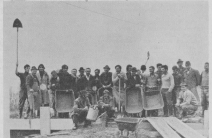
Oboroženi s svojimi zidarskimi rekviziti so se veselo nasmehnil v objektiv. Kako bodo šele veseli, ko bodo prerezali vrvico na novem domu.

Minilo je dobro leto, odkar so prebivalci Tomaža dobili vodovod, letos so dočakali asfaltiranje središča vasi z nekaterimi cestnimi priključki, sedaj v nedeljo, 8. oktobra, pa bodo praznovali otvoritev nove šole. Slovesnost ob tem „dogodku stoletja“ bo ob 10. uri dopoldne pred novo šolsko zgradbo. V programu bodo nastopili učenci tamkajšnje osnovne šole ter godba na pihala in združeni zbori iz Ormoža. Potem bo v prosvetni dvorani veselica, ki jo pripravljajo pršetinski in ključarov-