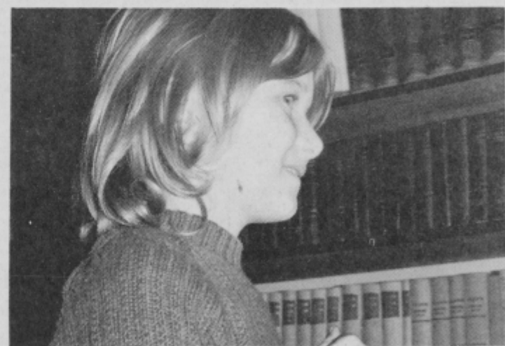
Toľiko lepih knjig! Kdaj jih bom lahko vse prečitala?