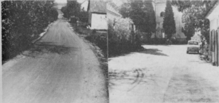
Blato je zamenjala asfaltna plast. Sliki prikazujeta del ceste proti pokopališču in središče vasi.