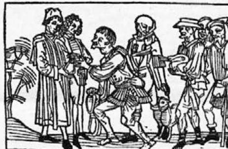
Kmetje pri plačevanju dajatev

Svobodna Slovenija, št. 22; 22. maja 1951