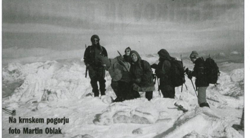
Na krmskem pogorju

Soška fronta je bila dolga prek 600 km in je potekala od Tržaškega zaliva, čez Doberdob, Banjško planoto, zahodno od Tolmina, se nato vzpela na Krn, pa mimo Bovca na Rombon, od tod pa na Nevejsko sedlo in Zahodne Julijce. Na Krnu in sosednji Batognici so se odvijali najhujši boji v prvi zimski soški fronti 1915/16, ko so Italijani zavzeli sam Krn, nato pa še del Batognice. Ker Italijani Batognice v celoti niso mogli osvojiti v neposrednih spopadih, so se zatekli k zvijači. Spomladi in poleti 1917 so začeli kopati podzemne rove, da bi tako prišli pod položaje avstrijske vojske in jih pogнали v zrak. Avstrijci so to ukano odkrili in sami začeli kopati svoj rov proti Italijanom. Bili so še pravočasni in so že nastavljeni eksploziv sprožili pred