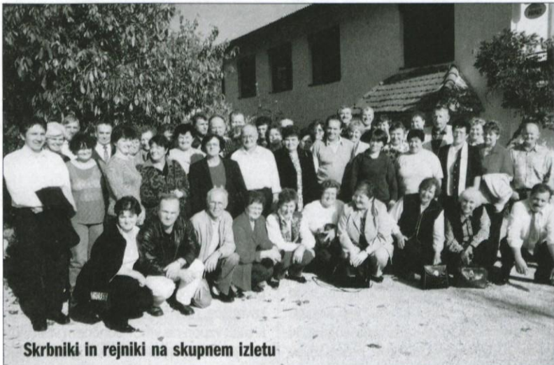
Skrbniki in rejniki na skupnem izletu

Tudi letos smo se zopet zbrali skrbniki in rejniki na tradicionalnem izletu. Tokrat nas je pot vodila v Črno na Koroško. Pogled skozi okno avtobusa je bil prekrasen, saj se je narava bohotala s prelepimi jesenskimi barvami, pa tudi sonce je prijetno sijalo, ob postanku v Črni nam je bilo že kar toplo.