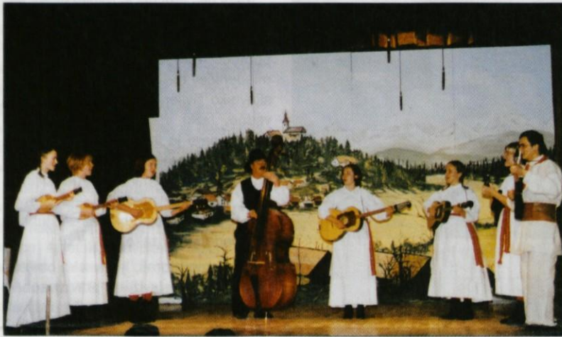
Nova pridobitev - tamburaška skupina

Verjamemo v čarobno moč božičnika, zato smo ga odrezali kos tudi vam, da bi skupaj delili veselje in pričakovanja ob odhodu starega in prihodu novega leta.