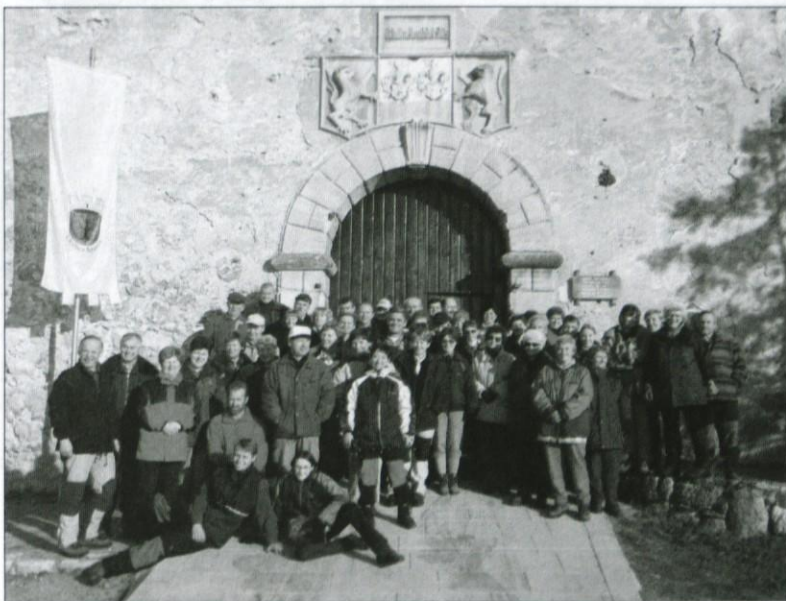
Pohodniki pred sevničkim gradom

Lepa jesen je prišla in z njo pričakovani in načrtovani planinski pohod: IZLET V NEZNANO.