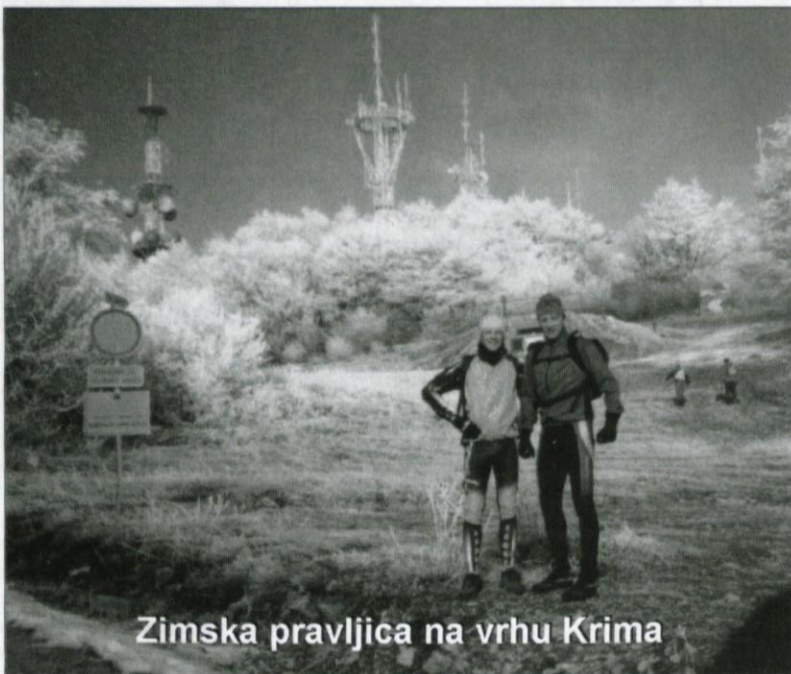
Zimska pravljica na vrhu Krma

Čudovito jesensko vreme nam je omogočilo podaljšanje kolesarske sezone skoraj do konca leta. Tako smo letošnjo jesen izkoristili za osvajanje vrhov, ki se ponajraje z nadmorsko višino zapisano štirištevilično.