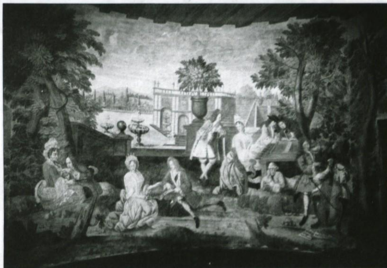
Freska v sevničkim gradu