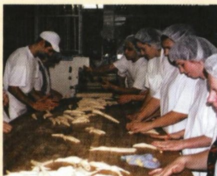
Peki že desetletja ročno pripravljajo praznične kruhe in pecivo in verjamejo, da ima tudi danes kruh, pripravljen z ljubeznijo in dobro voljo, čarobno moč.