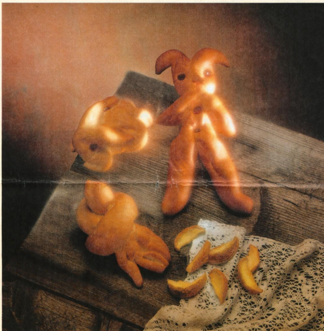
Iz Pekarne Grosuplje diši po praznikih, parkeljni, ptički in zajčki.

Prvi decembrski praznik, ki se ponaša s praznično peko, je Miklavž. Takrat se manjših sladkih dobrot in pekovskega peciva najbolj razveselijo otroci. Tudi v Pekarni Grosuplje ob praznikih najprej pomislijo nanje. Za Miklavža jim tako spečejo fine parkeljne. Spretni grosupeljski mojstri peki pa ob podobnih priložnostih po naročilu oblikujejo tudi ptičke in zajčke, ki so prav tako globoko zakoreninjeni v dolenski tradiciji. Pred novim letom najmlajše razveselijo še s pisanimi pečenimi smrekicami.