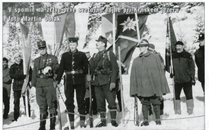
V spomin na žrtve prve svetovne vojne pri Krmskem jezeru

kilometrih in dobri uri pritiskanja na pedala smo premagali 780 metrov višinske razlike in osvojili 1100 m visok Krim. Nagrada je bila veličastna. Gora nam je postregla s čudovitim razgledom. Dolina je bila zavita v kot mleko belo meglo, iz nje so moleli samo najmogočnejši predstavniki Julijcev, Karavank in Kamniških Alp.