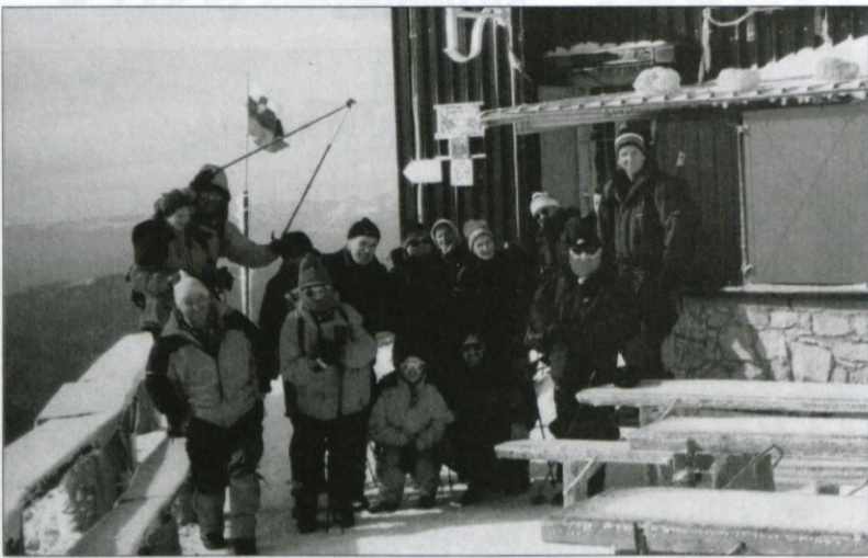
Grosupeljski planinci v polarnem mrazu pri Gomiščkovem zavetišču

V soboto, 10. 11. 2001, smo se planinci Planinskega društva Grosuplje, petnajst se nas je zbralo, odpravili na Krn. Janez, voditelj pohoda, je pot načrtal preko vrha Krna, do Krmskih jezer, kjer je bila proslava v počastitev konca prve svetovne vojne. Naš pohod je imel simboličen pomen - z njim smo počastili spomin na vse žrtve soške fronte.