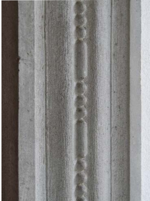
Slika 2: Valoviti profil na licu pokončnika portala cerkve v Gornji Košani, ki ga krasijo bisernik in za Severja značilna drobna klinasta utora.

Kakor sledi iz nadaljnjega opisa, pa je na gornjem delu portala v Gornji Košani še ena zelo prepoznavna značilnost tega mojstra.