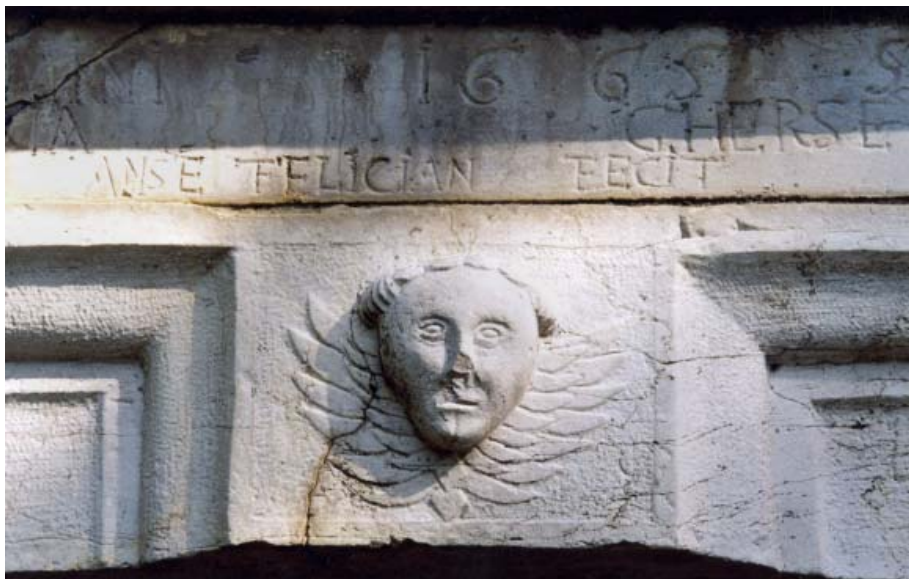
Slika 4: Gornji del portala cerkve Marije Snežne na Gradiščah pri Črnotičah iz leta 1665 z napisom in podpisom mojstra Anžeta Felicijana.