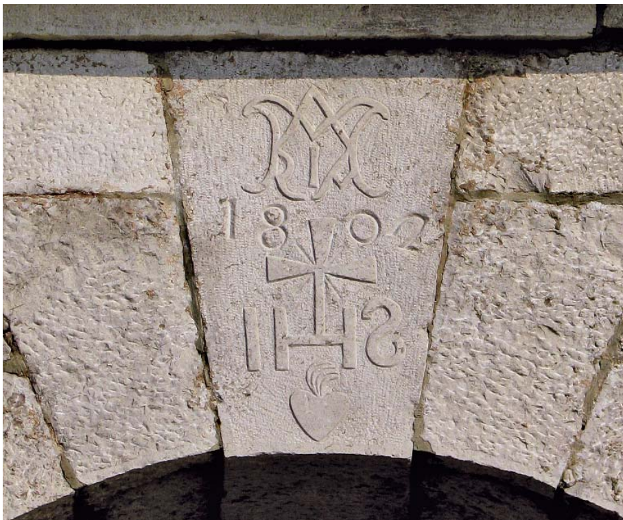
Slika 5: Marijin in Jezusov monogram na sklepnem kamnu arkade zvonika Marijine cerkve na Tabru, ki sta pomembno prispevala k oblikovanju repentabskega kamnoseškega stila.

V znamenju IHS je osrednja črka H z dolgo ravno prečko, s križcem, ki ima razmeroma velike klinaste krake in štiri žarke, vrezane v pazduhah med njimi, ter s širokim simetrično oblikovanim plamenečim srcem. Črke in križec so razmeroma nizki. Marijin monogram sestavljajo povečana začetnica M z ukrivljenima debloma in kratkima krakoma ter manjše ostale črke, ki so vkomponirane vanjo ali se prepletajo z njenima krakoma. Ker je repentabska cerkev posvečena Mariji, je tukaj – v nasprotju s hierarhijo svetih oseb – njen monogram na prvem mestu. Tudi pogostno pojavljanje obeh monogramov ali zgolj Marijinega monograma na portonih in kapelicah na območju Repentabra lahko pripišemo dejstvu, da je Marija zavetnica župnije.