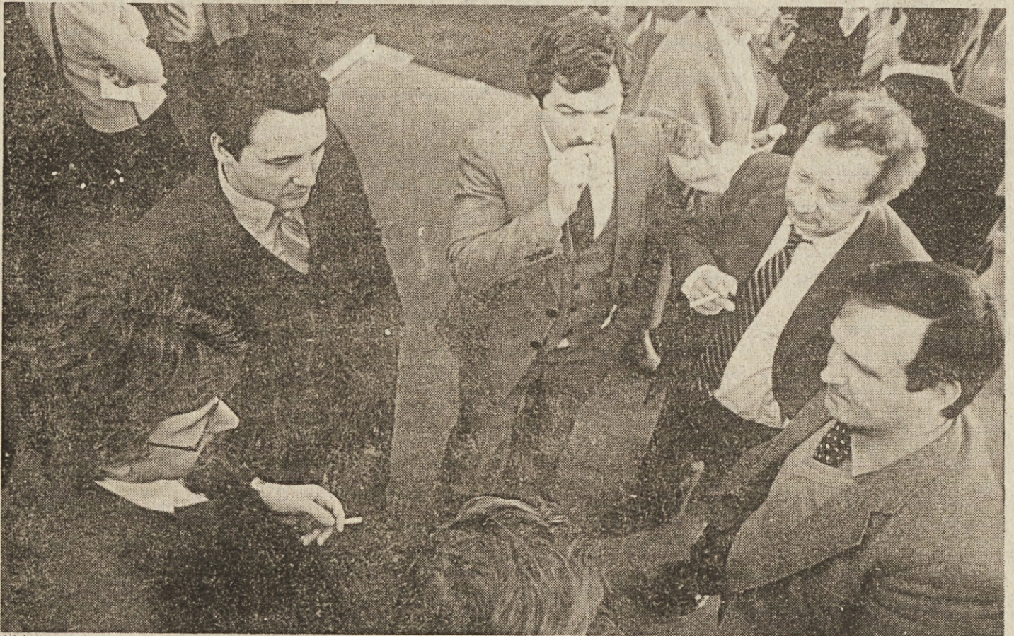
Posvetovanje je bilo priložnost tudi za neformalno izmenjavo večkrat dragocenih izkušenj.

Predsedstvo republiškega sveta Zveze sindikatov Slovenije bo spremljalo priprave in izvedbo letnih sej občinskih, mestnih in medobčinskih svetov zveze sindikatov ter občinskih in republiških odborov sindikatov dejavnosti.