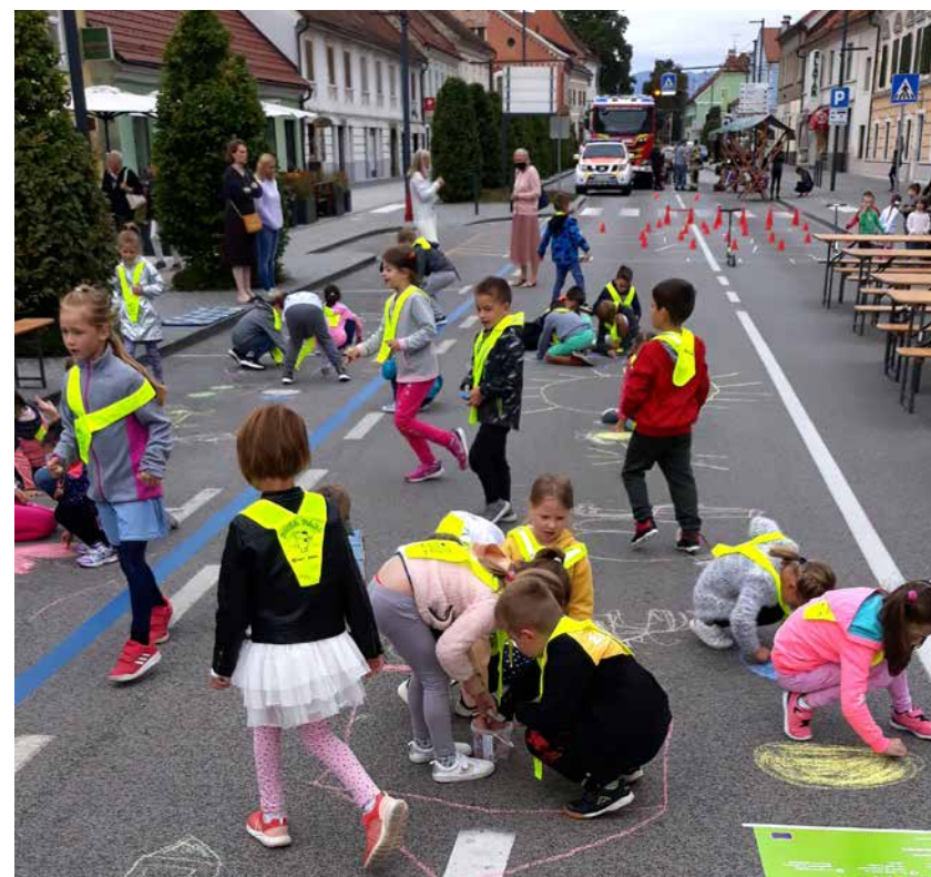
Otroci so tokrat namesto avtomobilov zasedli Šlandrov trg.

kusili v mini golfu na tržnici, raznih mini športnih turnirjih v Športnem centru Žalec ali se preprosto ukvarjali z drugimi organiziranimi športnimi aktivnostmi, ki so vsekakor tudi povezane s trajnostno mobilnostjo.