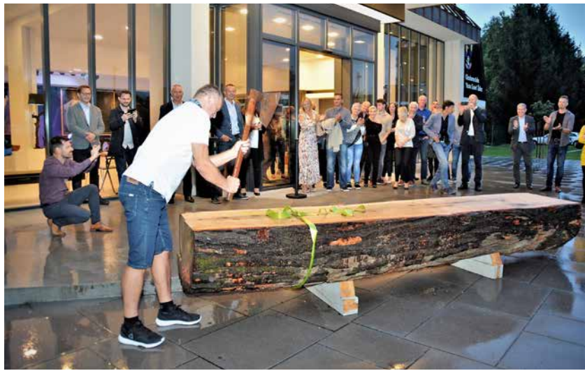
Za darilo je dobil tudi deblo topola za svojo »Noetovo barko«.