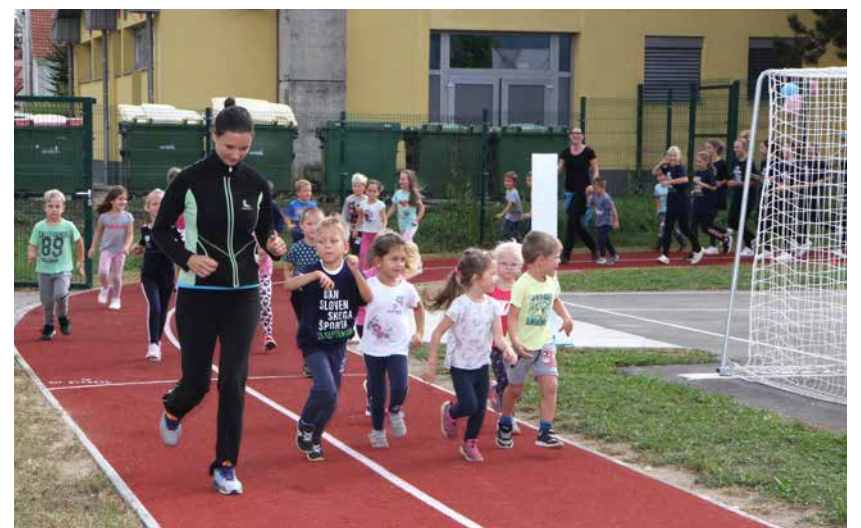
Po odprtju so najmlajši iz vrtca iz vzgojiteljico in učenci osnovne šole tekli častni krog.