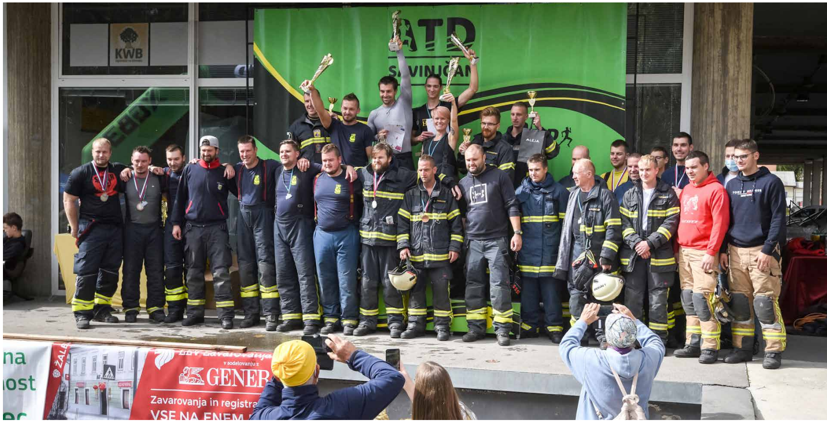
Gasilci slavili prvo udeležbo v teku na stolpnico

Minulo soboto je Atletsko tekaško društvo Savinjan pripravilo že tretji Juriš na Hmezad, tek na najvišjo stolpnico v Savinjski dolini, v katerem je treba premagati 256 stopnic v 14 nadstropjih