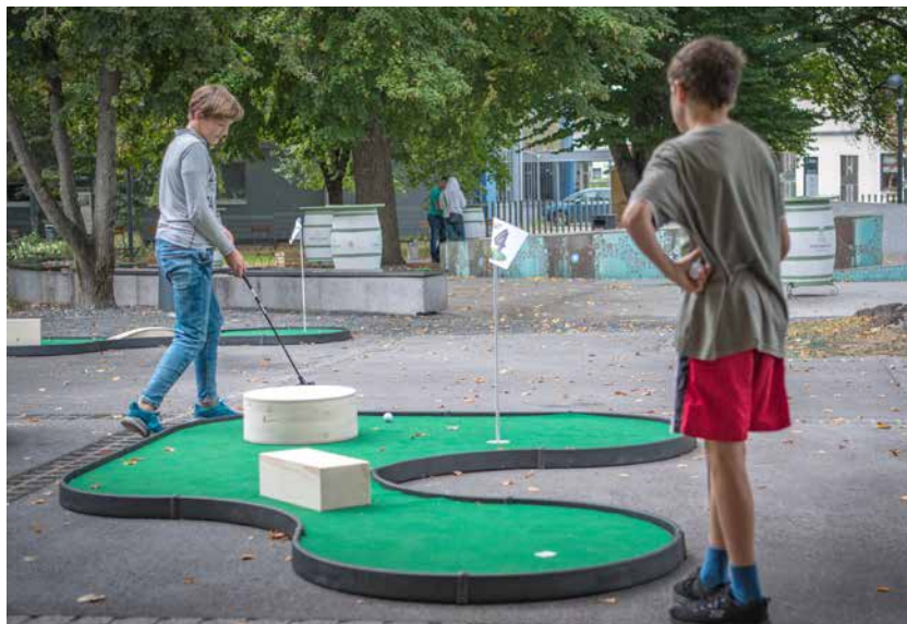
Mini golf z devetimi luknjami so zaradi slabega vremena prestavili v celoti k tržnici.

V Žalcu so za praznik na prostoru med fontano piv in Šlandrovim trgom pripravili mini golf z devetimi luknjami, v Športnem centru Žalec pa vadbo za hrbtnico in preventivno vadbo, test hoje na dva kilometra in skupaj z žalsko teniško akademijo Vebrov teniški memorial za moške do 50 let, nad 50 let in za ženske.