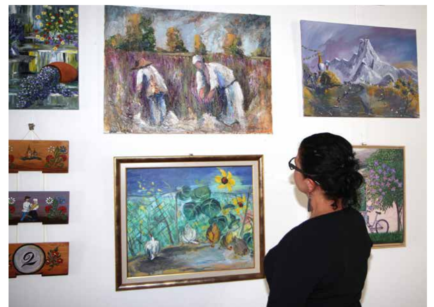
Triindvajset avtorjev se je predstavilo z različnimi tehnikami.

Na gradu Komenda je bila do 14. septembra odprta razstava likovnih del članov Kulturno umetniškega društva Polzela. 23 likovnikov je v različnih tehnikah ustvarilo raznolike poslikave na platno in na panjske končnice.