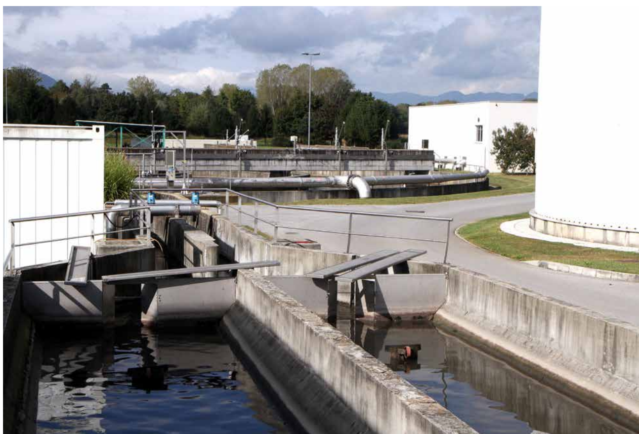
Čistilna naprava v Kasazah

»Malenkost se povečuje, čeprav se je sedaj v glavnem stabilizirala. Ko smo leta 1991 začeli samostojno pot