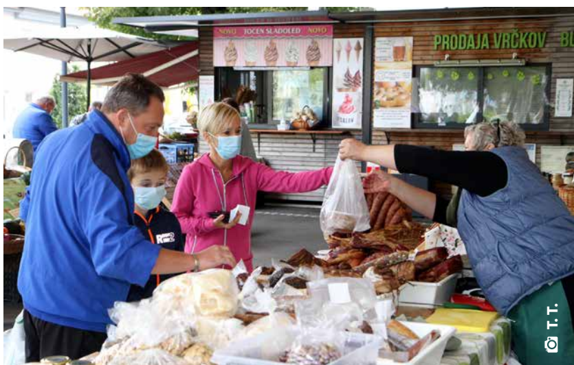
Nošenja mask smo se že navadili, veliko ljudi jo uporablja tudi v kontaktih na prostem.