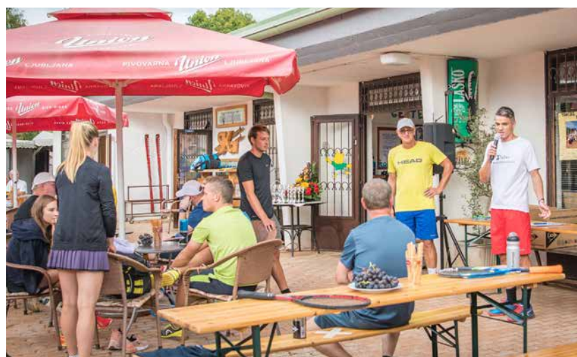
Vebrov memorial organizirajo v Žalcu že trideset let.

Lahko obkljukamo zapis s spletne strani ZKŠT: »Slovenci smo športni narod. To ne potrjujejo le številni uspehi naših vrhunskih športnikov, temveč polna šolska igrišča, zapolnjene gorske oz. hribovske kočice, polne športne dvorane in fitnes centri po celi državi. Redna telesna dejavnost je izjemnega pomena za zdravje, ki je skupaj z duševnim zdravjem najpomembnejša sestavina zdravega življenjskega sloga.«