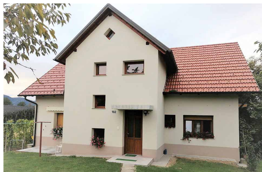
Hiša je sedaj ponovno dom štirim gospodinjstvom.

Požar, ki je izbruhnil v mansardnem stanovanju in šestim stanovalcem iz štirih gospodinjstev vzel njihov dom, je v javnosti že nekoliko pozabljen, a v stanovalcih bo spomin na nesrečo ostal za vedno. V požaru sta bili popolnoma uničeni dve mansardni stanovanji, zaradi posledic odpravljanja požara pa sta bili neprimerni za bivanje tudi obe stanovanji v pritličju. Vse družine so bile začasno pod drugo streho, tri pri sorodnikih, ena v stanovanju Občine Žalec, ki je za obnovo zagotovila tudi znaten del sredstev. Po požaru so pri čiščenju poškodovane stavbe in okolice priskočili na pomoč gasilci PGD Griže, žalsko območno združenje Rdečega križa pa je začelo z zbiranjem finančnih sredstev za obnovo hiše na posebnem transakcijskem računu. Potek zbiranja donatorskih sredstev je spremljal Odbor za pomoč Migojničanom in s stanovalci organiziral tudi posvete o načinu porabe sredstev. Na transakcij-