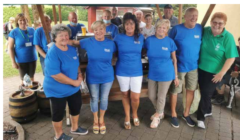
Člani turističnega društva Šempeter so za pohodnike odprli tudi nekropolo, jih odžejali s pivom in okrepčali s prigrizki.