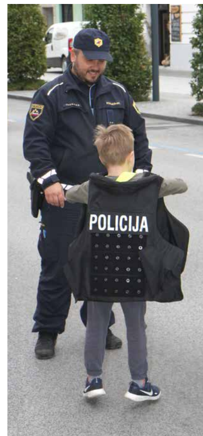
Policijska oprema je vedno z njimi

Dan brez avtomobila pa so pripravili v petek, 18. septembra. Na Šlandrovem trgu so cesto zaprli za promet in dali prednost ljudem namesto avtomobilom. Sledile so razne predstavitve in aktivnosti, kot so: predstavitev električne mobilnosti, parkirišča v igrišča, varnost v prometu, spretnostni poligon, bralni kotiček, predstavitev dela gasilcev in policije, zdravje in promet, spreminjanje prostora za ljudi in podobno. Evropski teden mobilnosti v Žalcu se je 23. septembra zaključil s prazničnim dnevom slovenskega športa, na katerem so se lahko udeleženci preiz-