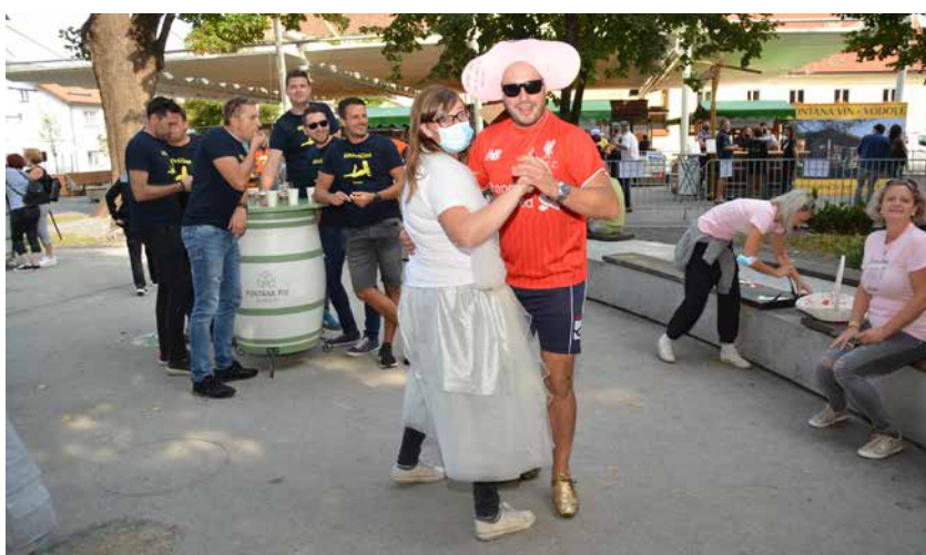
Žalska fontana vabi različne skupine ob zanimivih priložnostih.