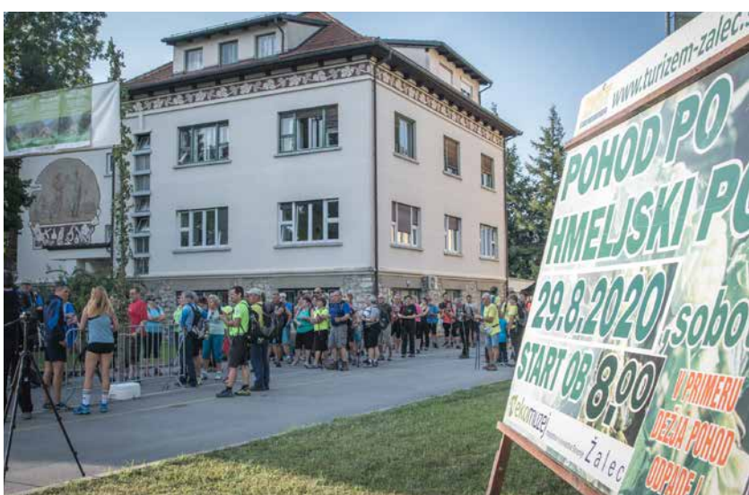
Kar množično so se pohodniki razveselili pohoda.