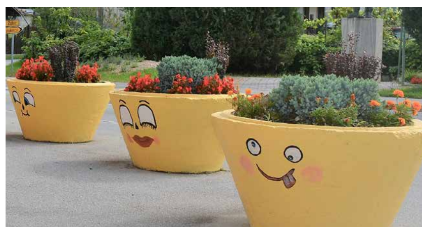
Obnovljena korita s »smeškoti«