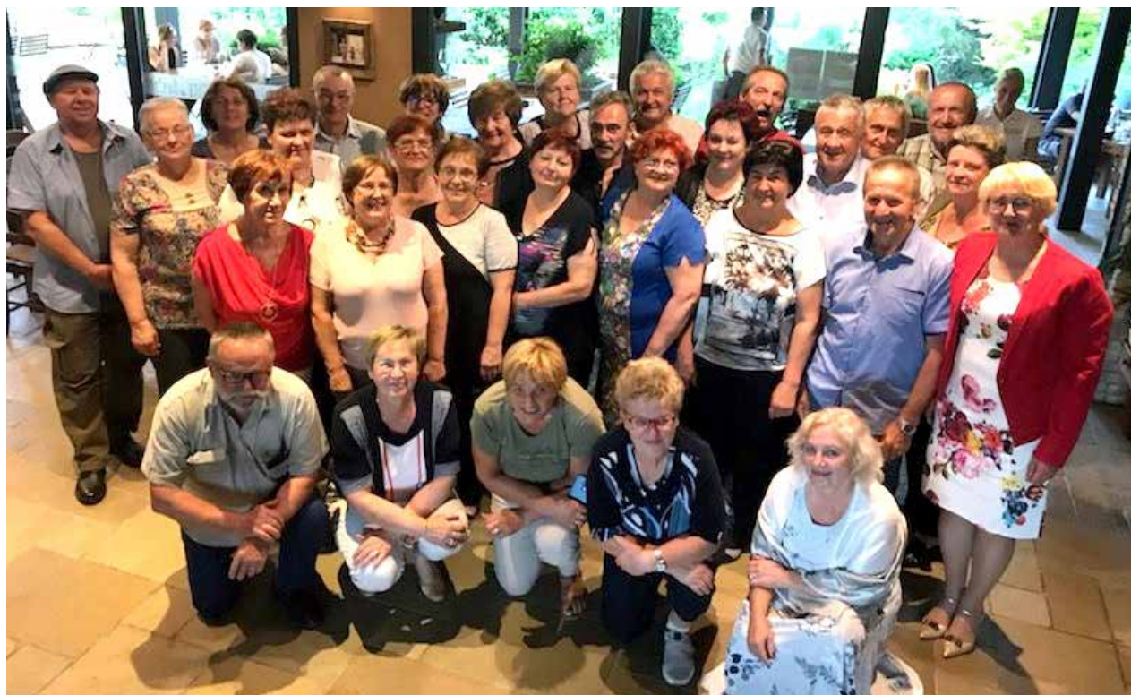
Udeleženci srečanja ob 50. obletnici osnovne šole

Pikl. Skupaj so se sprehodili po razredih, ki so jih obiskovali, in obujali spomine na učitelje in sošolce. Srečanje so nadaljevali v znanem gostišču in se spominjali brezskrbnih šolskih dni.