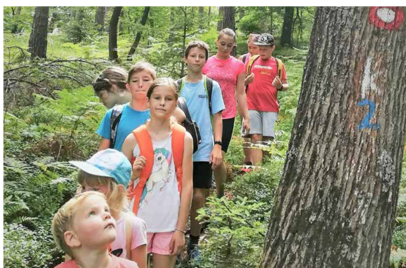
Na pohodu po poti K2 Family trail

V Planinskem društvu K2 iz Zaloča pri Šempetru v Savinjski dolini so izpeljali tradicionalni plezalni tabor, vendar zaradi covid-19 z omejeno udeležbo desetih otrok.