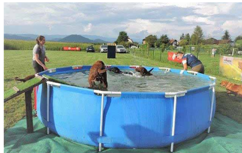
Na novem poligonu se lahko psi tudi kopajo v bazenu.