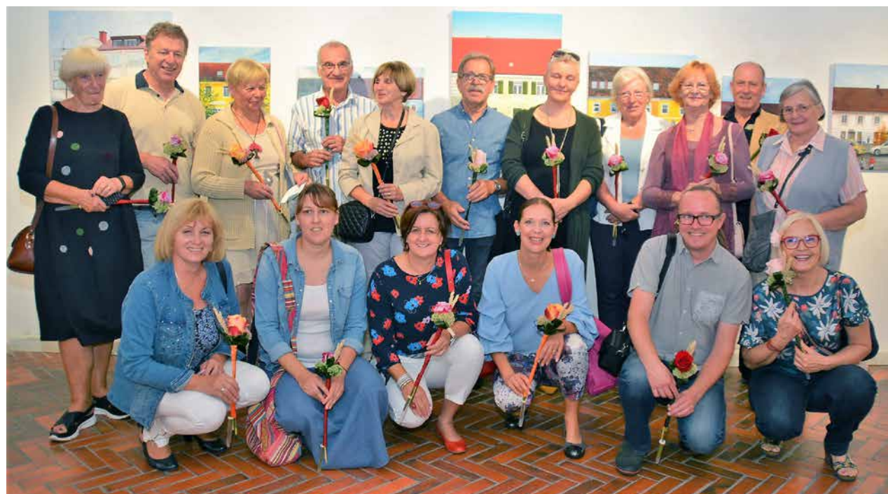
Razstavljalci z mentorjem (čepi drugi z desne)