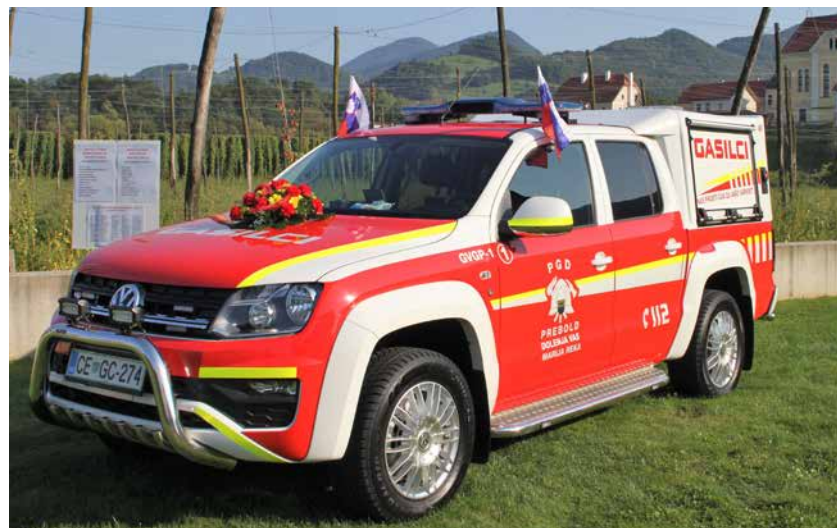
Nova pridobitev preboldskih gasilcev je večnamensko vozilo.

V nadaljevanju prinaša zbornik še: pregled članstva skozi zgodovino, predstavitev prijateljstva z gasilci iz Oberradlberga v Spodnji Avstriji, ki traja že skoraj petdeset let, in pobratenja z gasilci iz Trbovelj in Dola pri Hrastniku, pregled članstva po osamosvojitvi s tekmovalnimi dosežki in seznam današnjih članov. V zadnjem delu beremo o aktivnostih društva v zadnjih letih, povezanih zlasti z deli na gasilskem domu in gasilsko tehniko ter njihovim voznim parkom.