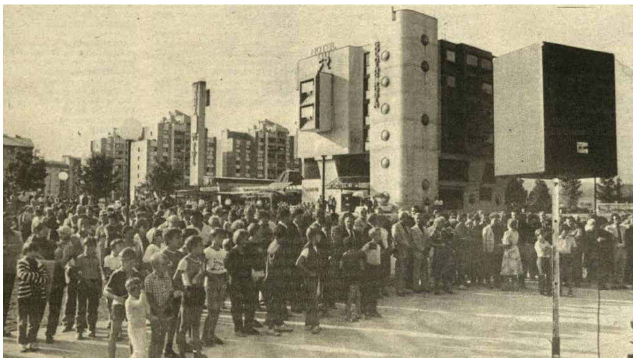
Množica, ki je 14. septembra prisostvovala odprtju doma.