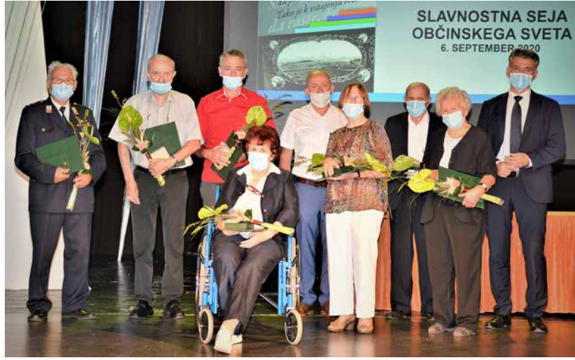
Letošnji prejemniki občinskih priznanj

Praznik Občine Žalec, ki ohranja spomin na 6. september leta 1868, ko je v Žalcu potekal II. slovenski tabor, je letos minil brez blišča in tradicionalnih prireditev.