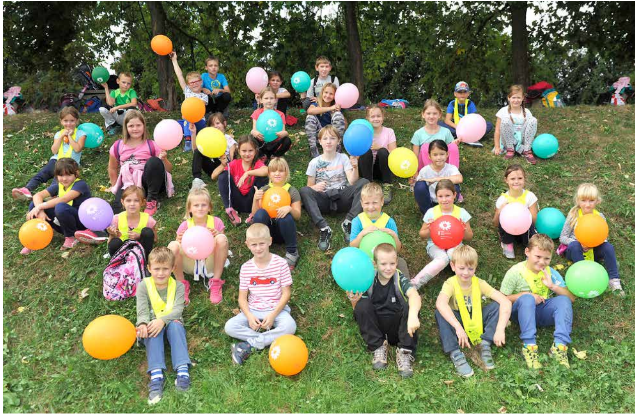
Šport je »kul«, menijo učenci POŠ Trnava.

23. septembra smo v Sloveniji prvič praznovali dan športa, ki so ga obeležili tudi na POŠ Trnava.