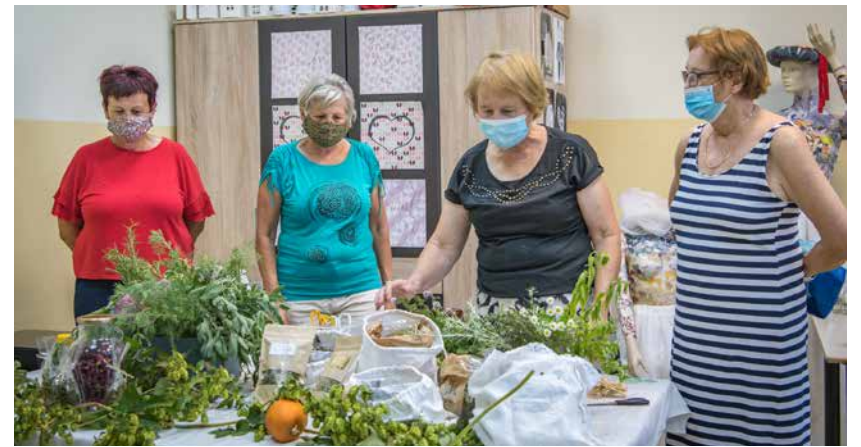
Zeliščarke so predstavile zelišča, naravo in zdravje.

Žalska ljudska univerza sodeluje v Tednih vseživljenjskega učenja (TVU) že od samega začetka izvajanja tega vseslovenskega projekta pod okriljem Andragoškega centra Slovenije. Tako aktivno prispeva k promociji učenja in izobraževanja v Spodnji Savinjski dolini in širše v savinjski regiji. Z izvajanjem raznolikih dogodkov, prireditvev v TVU in koordinacijo najrazličnejših institucij na našem območju pomaga pri udeležanju slogana »Slovenija, učeča se dežela« ter pri ureničevanju nacionalnih in evropskih strategij na področju izobraževanja. Osrednjo vlogo v TVU ima Parada učenja – Dan učech se skupnosti. Žalec je letos, prvič v zgodovini njenega izvajanja, ni doživel. Vseeno pa so lokalno odprtje TVU obeležili 9. septembra.