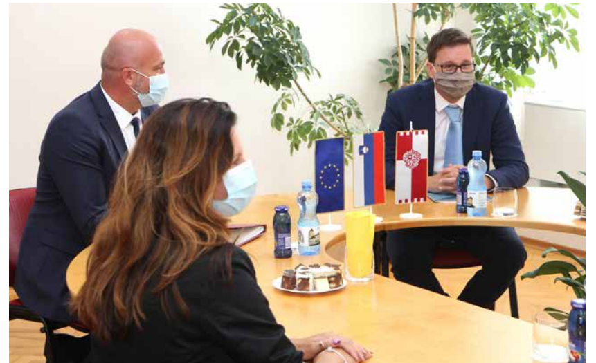
Minister Koritnik med pogovorom na Občini Braslovče

Na obisku v Braslovčah in Žalcu so se pogovarjali o odzivu lokalnih skupnosti na epidemijo in o novem zakonu za finančno razbremenitev občin.