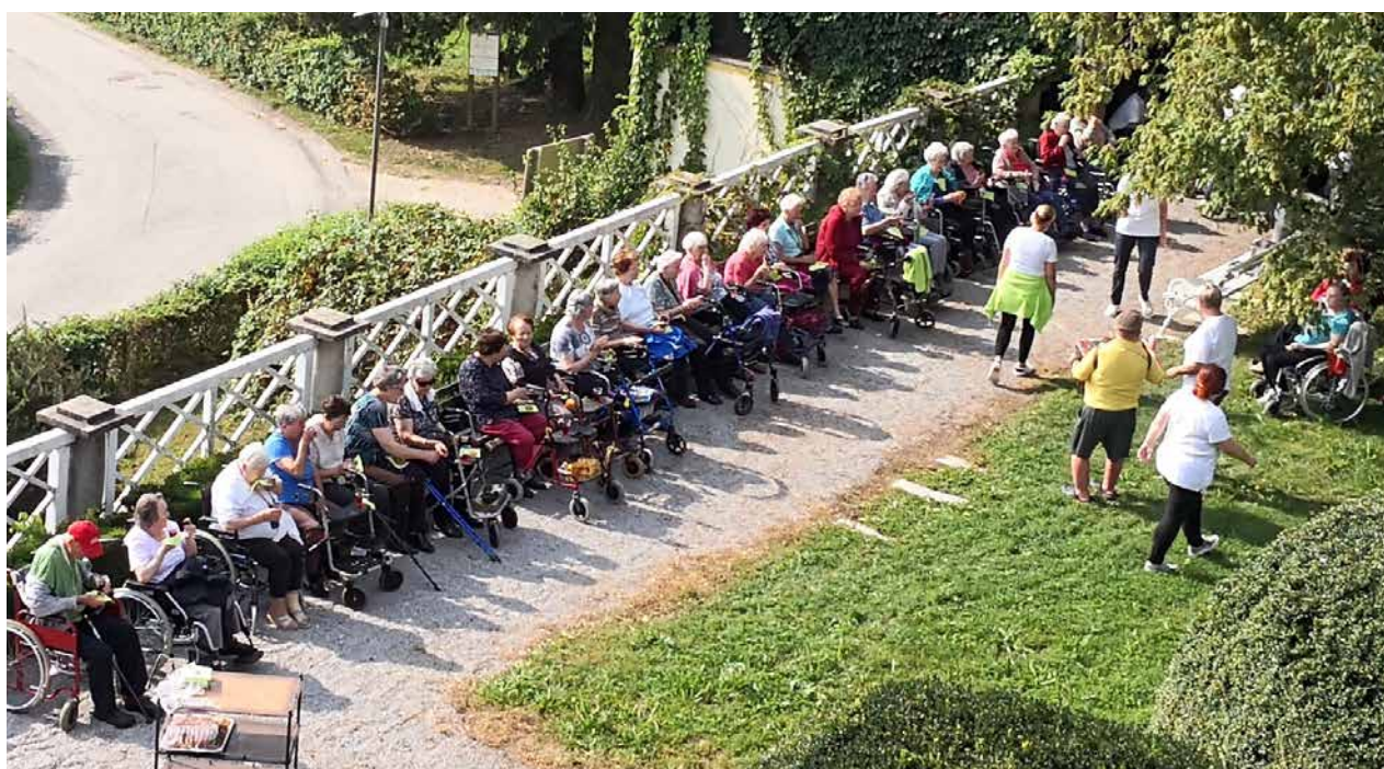
Stanovalci doma v parku Šenek

Ob 21. septembru, svetovnem dnevu Alzheimerjeve bolezni, so v številnih krajih po Sloveniji, že tretjič tudi v Domu upokojencev Polzela, pripravili t. i. sprehode za spomin, s katerimi želijo opozoriti na naraščajoči problem te bolezni. Sprehodili so se do parka Šenek.