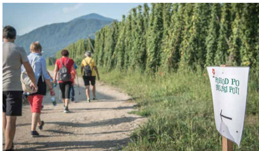
Sonce in dobra volja sta pohodnike pospremila med hmeljišči, po poljih, ob Savinji ...