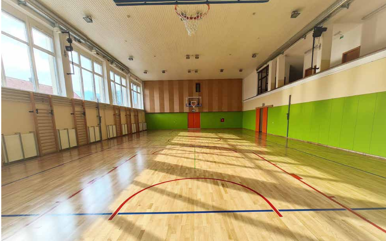
Telovadnica, ki je hkrati tudi večnamenska dvorana, je prenovljena.

Občina Tabor je s prenovljeno telovadnico pridobila sodobnejši in varnejši prostor za športne vadbe, prireditve in družabne dogodke.