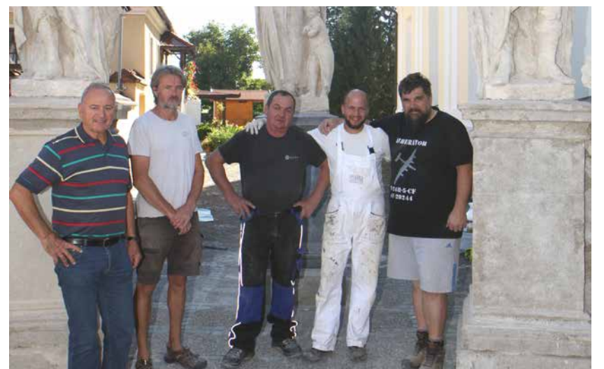
Restavratorska skupina s patrom Vančijem

V soboto, 5. septembra, je restavratorsko podjetje GNOM iz Šentvida pri Stični vrnilo obnovljene Petrovške križe na svoje mesto.