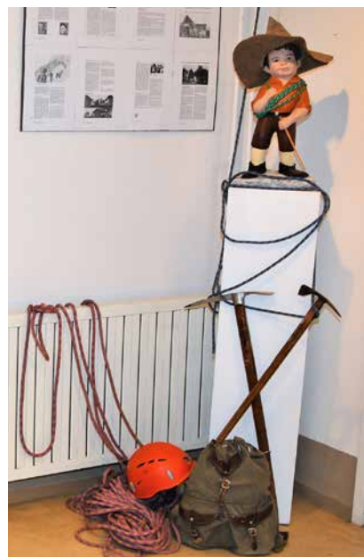
Del razstave ob 70-letnici

ravljena z namenom obuditi spomin na minulih 70 let, zlasti na vse dogodke, ki so povezani s Homom. Razstavo sestavljajo likovna dela, fotografije, različni arhivski dokumenti, vpisne knjige, članki, zapisi o društvu in njegovih sekcijah, planinskih taborih, izletih planincev, planinskih vodnikov, gorski straži, markacistih, planinskih dogodkih na domači planinski koči, v bivakih na Gozdniku in Kamniku ..., skratka utrinki iz življenja PD Zabukovica, ki je bilo ustanovljeno 6. aprila 1950.