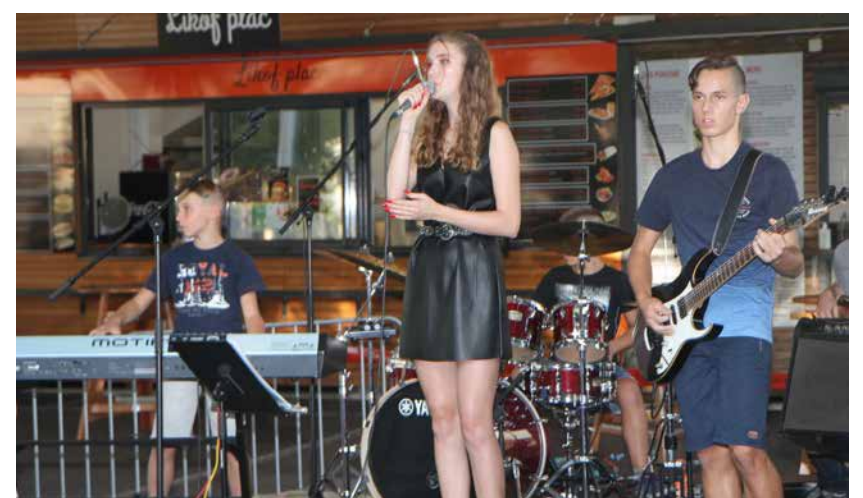
Skupina Raptors s Polzele

V soboto, 5. septembra, je pod geslom Novi na odru na Fontani piv Zelena zlato v Žalcu nastopila mlada polzelska skupina Raptors rock band.