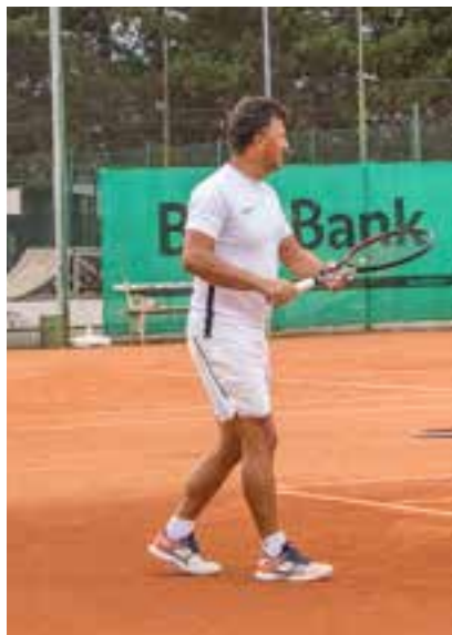
Tudi občasni dež ni pregнал tenisačev.

Državni zbor je na predlog OKS – Združenja športnih zvez razglasil 23. september za nov državni praznik dan slovenskega športa.