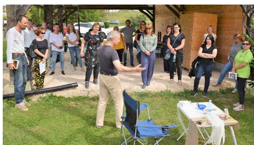
Udeleženci v Šeščah na domačiji Kočvarjevih

Udeleženci so si ta dan ogledali muzejsko zbirko Prebold skozi čas, medgeneracijski center v Dolenji vasi