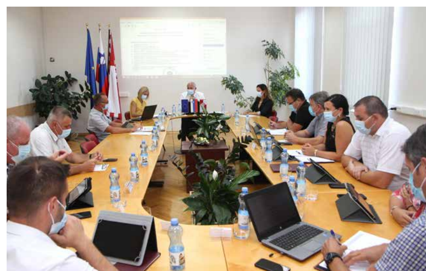
S seje v Braslovčah