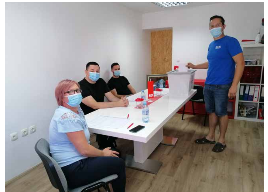
Z volišča na sedežu stranke v Žalcu

Socialni demokrati verjamejo v močno vpetost članstva v delovanje in odločitve stranke. Zato so za večjo povezanost poskrbeli s spremembami statuta, s katerimi so uvedli nov institut regionalnega koordinatorka. Njegova naloga bo poskrbeti za še boljšo organiziranost mreže na terenu in povezavo med vodstvom stranke in članstvom.