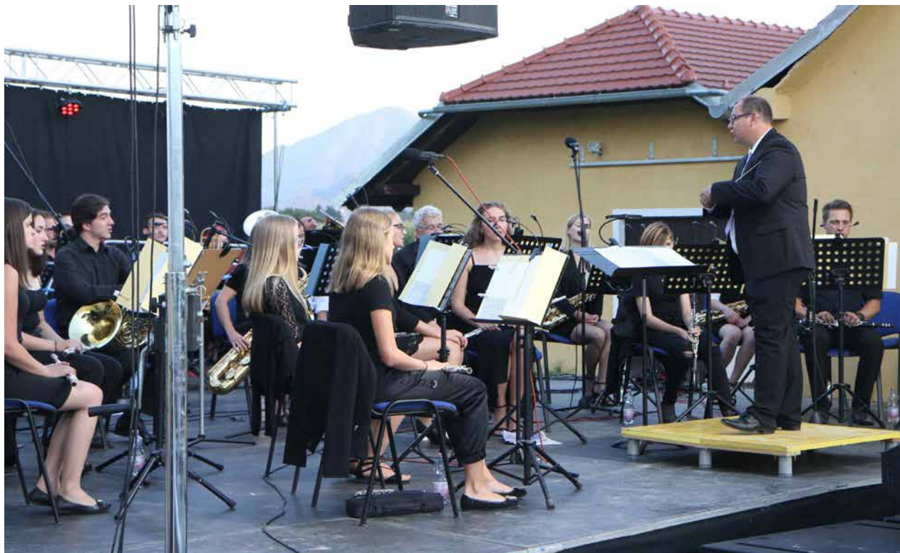
Z jubilejnega koncerta Pihalnega orkestra Cecilija Polzela

Pihalni orkester Cecilija Polzela je v začetku septembra ob desetletnici delovanja pripravil koncert na prostem.