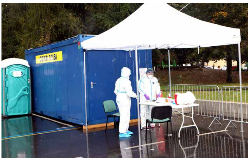
Modri zabojniki pred Zdravstvenim domom Žalec od četrta služijo jemanju brisov za testiranje na covid-19.

ži. Kajti le tako bomo uspešni, boljši tudi v bodoče. Športni duh, ki sem ga omenila na začetku, velja še bolj kot v drugih časih udejanjiti v vseh sferah življenja in vodenja te doline. V najpomembnejših tekmah namreč nikoli ne zmagajo dobri posamezniki, ampak povezane, srčne in borbene ekipe. Ekipa Spodnje Savinjske doline, zmagujmo skupaj! Naj vas povezuje tudi naš časopis Utrip Savinjske doline, ki o vaših zmagah piše najraje.