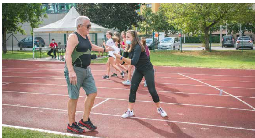
Udeleženci so lahko sodelovali v testu hoje na 2 km.