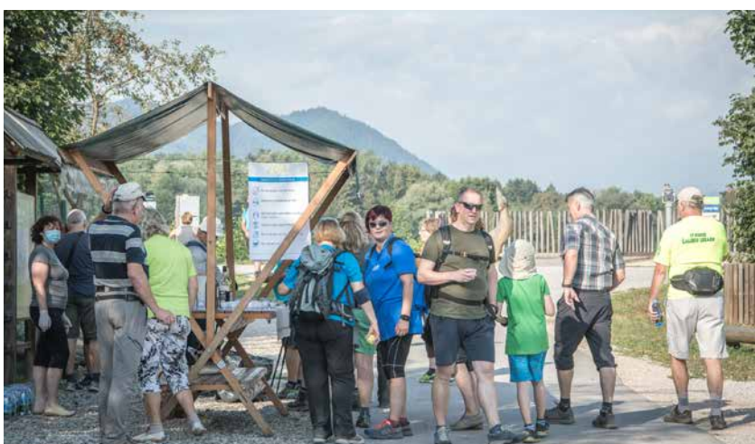
Ob Ribniku Vrbje sta pohodnike »razkužili« člani TD Vrba Vrbje.