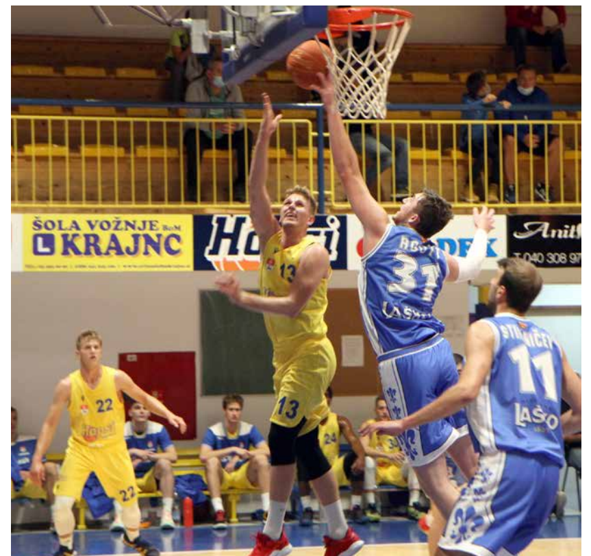
S tekme Hopsi : Zlatorog

Minulo soboto, 26. septembra, se je pričela jubilejna 30. sezona v prvi slovenski košarkarski ligi. Hopsi s Polzele so v prvem krogu doma gostili ekipo Zlatoroga iz Laškega in srečanje izgubili z rezultatom 66 : 83.