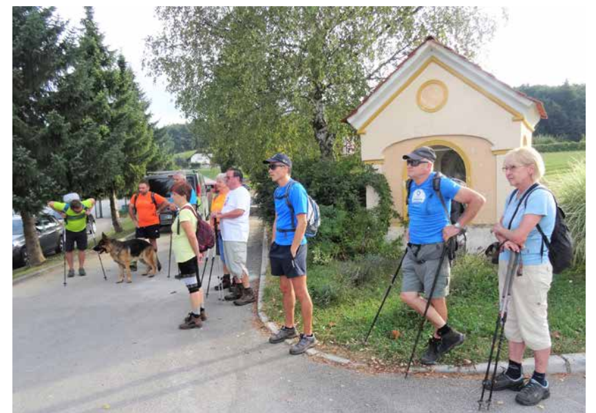
Del udeležencev pohoda ob obnovljeni kapeli pri gasilskem domu na Ponikvi