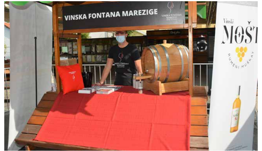
V Marezigah je prva fontana, ki je nastala po žalskem zgledu.