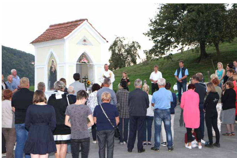
S slovesnosti ob blagoslovitvi kapele

Na praznik malega šmarna, v torek, 8. septembra, so po maši v farni cerkvi sv. Andreja v Andražu nad Polzelo blagoslovili obnov-