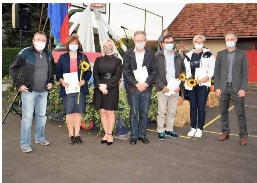
Dobitniki letošnjih priznanj s predsednico in podpredsednikom Sveta KS

Letošnje Petrovčevanje bi bilo jubilejno, že deseto po vrsti, a je žal zaradi koronavirusa večina prireditev odpadla.