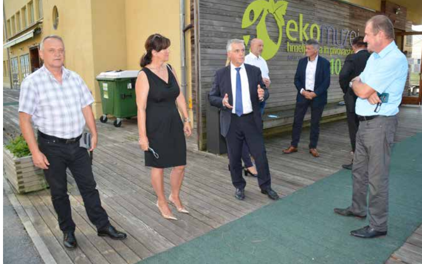
Minister v pogovoru s predstavniki Desusa

Pristojne komisije Skupnosti občin Slovenije so v torek, 15. septembra, v Žalcu obravnavale predlog Zakona o dolgotrajni oskrbi.