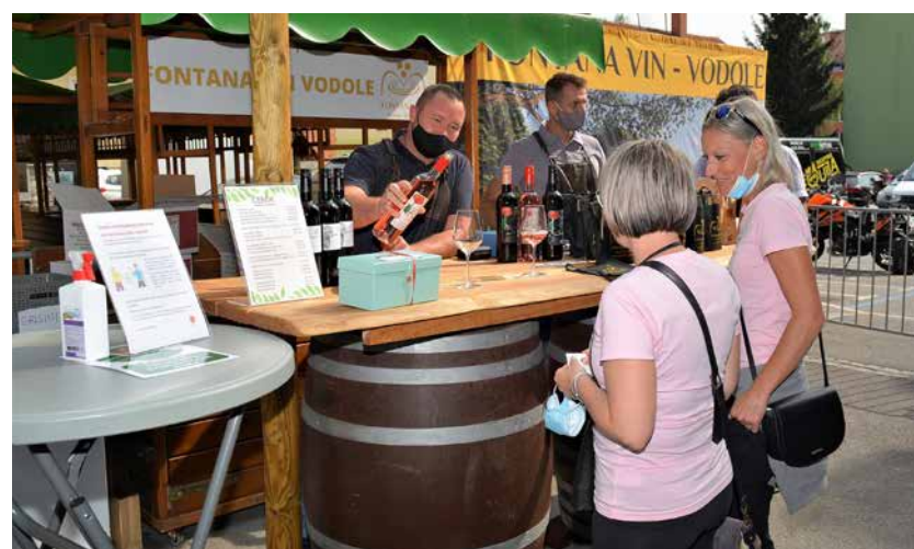
Fontana v Vodolah ponuja le vrhunska vina poznanih vinarjev.

so fontane, lahko ponudimo marsikaj. Hkrati sem vesel, da je srečanje danes, saj bi bila kasnejša izvedba dogodka zaradi vseh ukrepov, ki bodo morda še sledili, vprašljiva. Kot lahko vidimo, obiskovalci spoštujejo vsa navodila NIJZ. Ljudje smo socialna bitja, potrebujemo družbo, Seveda pa nam to nič ne pomaga, če ne bomo zdravi. Tudi če si fizično zdrav, a osamljen in nimaš družbe ter socialnih stikov, lahko nevarno zbolíš. Zadnji čas je, da se strokovnjaki v zdravstvu povežejo s sociologi in antropologi in da skupaj najdejo najboljše, optimalne rešitve ne samo za fizično, ampak tudi za duševno zdravje.«