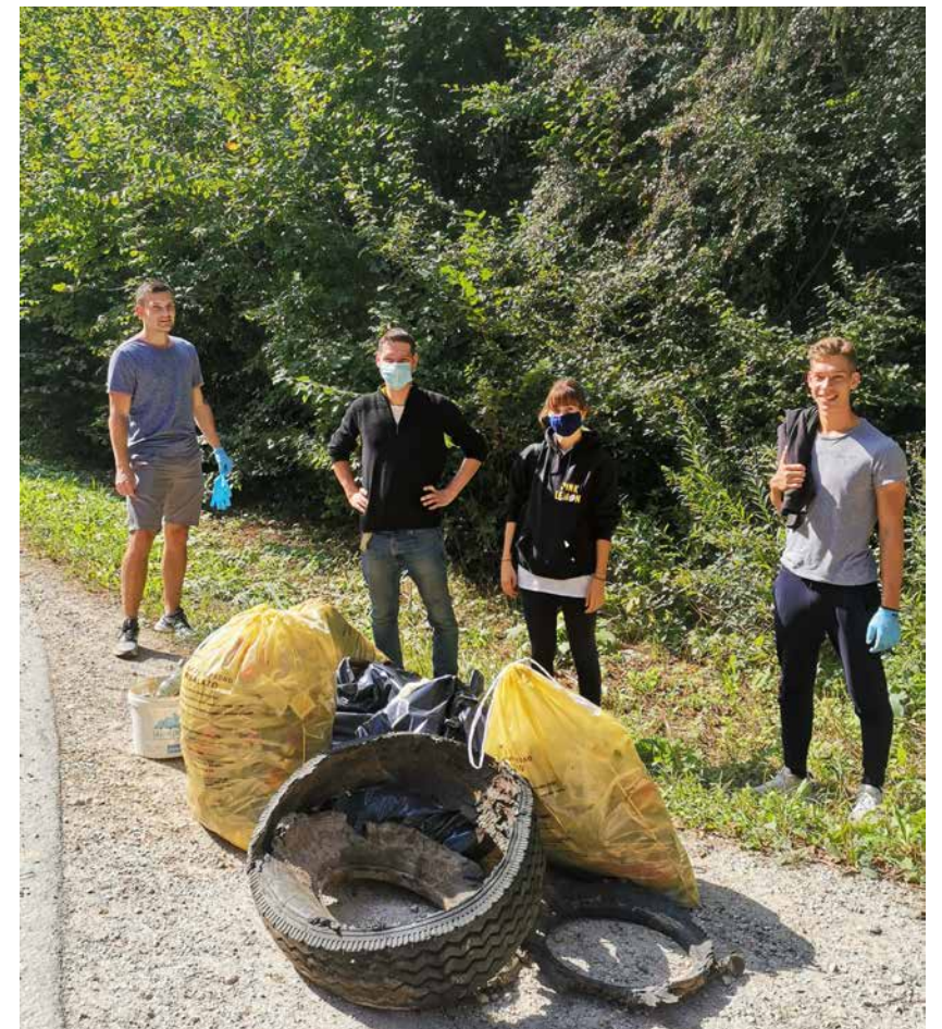
Ena od skupin z odpadki