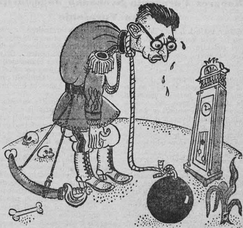
Draža Mihajlović, narodni izdajalec, odgovarjati bo moral za izvršene zločine.

Podatki iz Slov. poročevalca, 12-14/VIII.