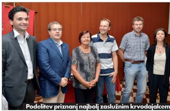
Podelitev priznanj najbolj zaslužnim krvodajalcem