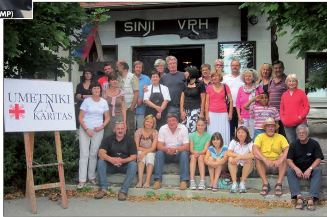
UMETNIKI ZA KARITAS