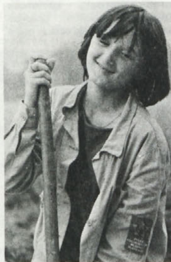
Malce zasanjan, morda samo hudomušen pogled – pa pridne roke, le kdo je ne bi bil vesel, mlade brigadirke!