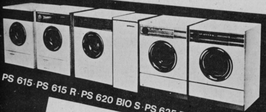
PS 615 · PS 615 R · PS 620 BIO S · PS 625 BIO S · PS 625 BIO

popolnejše pranje superavtomatsko enostavno z garancijo gorenje