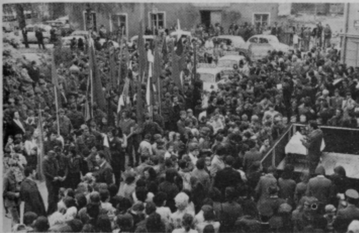
Prihod občinske štafete na osrednjo slovesnost v Slov. Bistrici.

bile v vseh krajih občine množične slovesnosti ob prihodu občinske štafetne palice, ki je letos pričela svojo pot v torek, 7. maja na gradbišču nove osnovne šole na Koblju (bistriško Pohorje) in je v dveh dneh prepotovala skoraj vse večje kraje v občini. Kljub temu, da je bila občinska štafeta, je bila zelo slovesno sprejeta v vsakem najmanjšem naselju. V večjih vaseh, Oplotnici, Polskavi, Pragerskem, Poljčanah, Makolah in še nekaterih pa so ob prihodu občinske štafete priredili tudi bogate kulturne programe. V prenosu štafetne palice je sodelovalo veliko število učencev osnovnih šol, članov aktivov ZM in mladih samoupravljalcev iz delovnih kolektivov. Med nosilci so bili tudi člani specializiranih organizacij in mladi iz JNA.