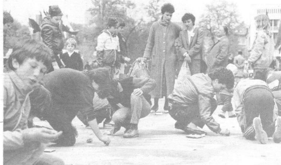
PIONIRJI SO POKAZALI KAJ ZNAJO - Na ulicah in trgih v ožjem središču mesta so otroci risali, recitirali, igrali, kotalkali...

Naj ob tem povemo še to, da so organizatorjem letošnjega Zbora pionirjev stopile naproti številne ljubljanske delovne organizacije, naši učitelji, otroci in starši pa so gostoljubno odprli vrata svojih domov mladim gostom. Ljubljana je spet dokazala, da zna odpreti vrata in da volja najde pot do novih spoznanj. To je bil eden od načinov praznovanja meseca mladosti, drugačen in mladim veliko bližji kot prejšnji.