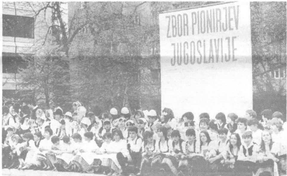
LJUBLJANA JE GOSTOLJUBNO ODPRLA VRATA - V slovenskem glavnem mestu so se zbrali pionirji in njihovi mentorji iz središč vseh republik in pokrajin.