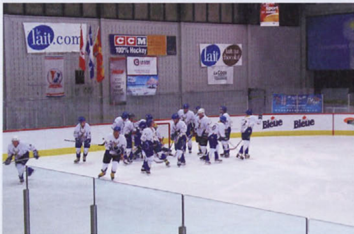
Hokejisti Jelena pred eno izmed tekem

Hokejisti HK Jelen so se prvič udeležili veteranskega svetovnega pokala, ki je potekal v Kanadi. S praznovanjem 20-letnice kluba bodo z manjšo slovesnostjo nadaljevali sredi maja, končali pa s tradicionalno hokejsko nočjo, ki bo letos 8. avgusta.