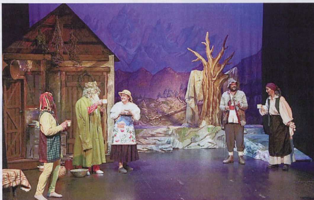
V "Pastirčku" se na koncu vse dobro izteče in vsi so zadovoljni, tudi gledalci.