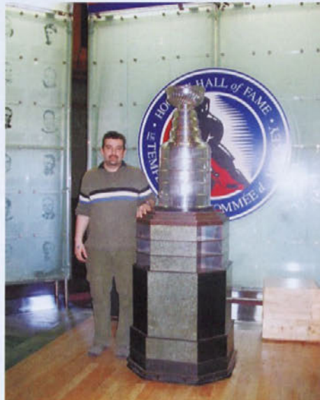
Stoš Kalan ob Stanleyevem pokalu v hokejski dvorani slavnih