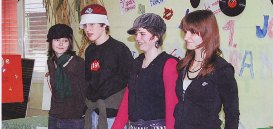
Utrinek s frankofonskega dneva na OŠ Preska