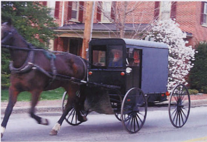
Amiši v okolici Lanchestra v Pensilvaniji