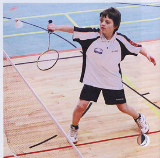
Miha ima dober občutek za igro.

Kot športnik skrbi tudi za svojo prehrano, oziroma za to poskrbi mama, ki jedi pripravlja v skladu z usmeritvami jedilnika, ki ga predpiše trener. Kar ima prostega časa, ga preživi pred televizijskim zaslonom in računalnikom,