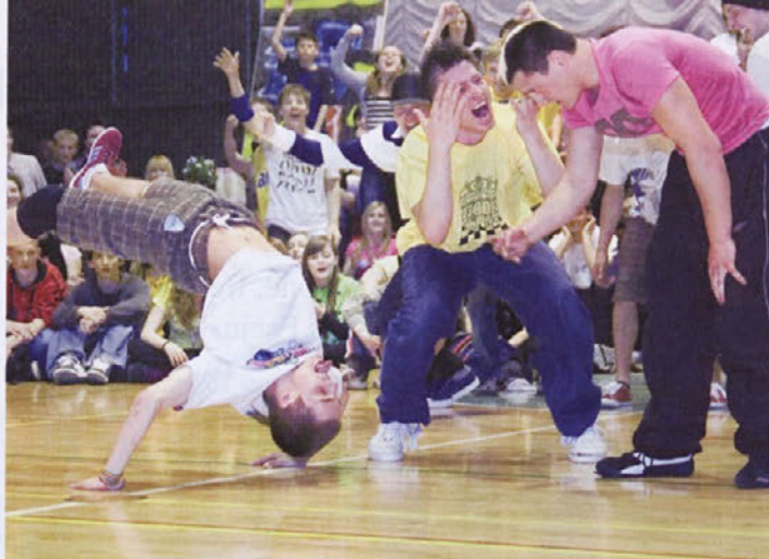
Občinstvo je navdušil tudi tekmovalec v break danceu.