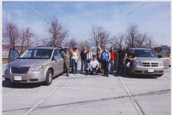
Popotniki - Niagara

"Igra nasprotnih ekip je bila neprimerno hitrejša, kar je bila naša poglavitna težava. Tudi po taktični in tehnični plati smo bili velikokrat v podrejenem položaju. Vendar rezultati so bili iz tekme v tekmo boljši in v zadnji tekmi smo se z nasprotniki že zelo dostojno kosali."