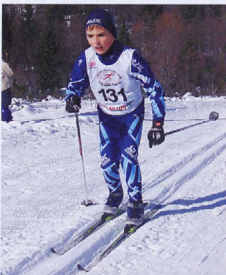
Teku na smučeh so tako kot alpskemu smučanju povečali število točk pri materialnih stroških, saj zahtevata bistveno višje osnovne stroške treningov.