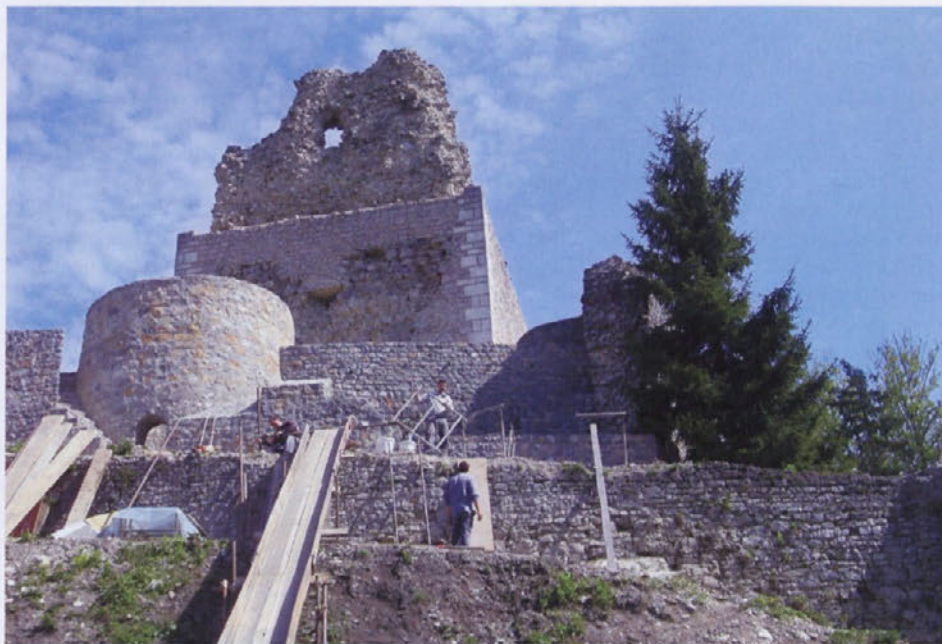
Aprila se je nadaljevala obnova južnega dela obzidja Smledniškega gradu.

Smledniški Stari grad je po pisnih virih s svojo strateško pozicijo postavljen v 11. stoletje. Imel je eno osrednjih vlog na širšem območju občine Medvode, kar je potrdil tudi dr. Andrej Gaspari iz Muzeja Slovenske vojske. "Sam potencial na tem območju je izjemen, ker gre za mrežo gradov v pokrajini, ki dokazuje posestno mejne vojaško strateške odnose. Medvode so bile prepredene z obrambno mrežo gradov in eno osrednjih vlog ima zaradi izjemne lokacije ravno Smledniški grad," je po-