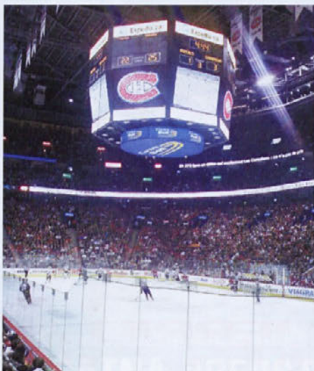
V Montrealu so si ogledali tekmo NHL med ekipama Montreal Canadiens in Buffalo Sabres.

Na turnirju ste odigral tri tekme in doživeli tri poraze. Primerjava vaše igre z drugimi ekipami v skupini?