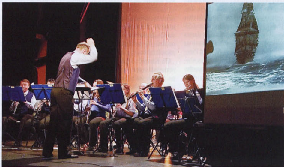
Večer filmske glasbe. Med nastopajočimi tudi Godba Medvode.