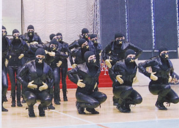
Hip hop formacija Bolera je ubranila naslov državnih prvakov.