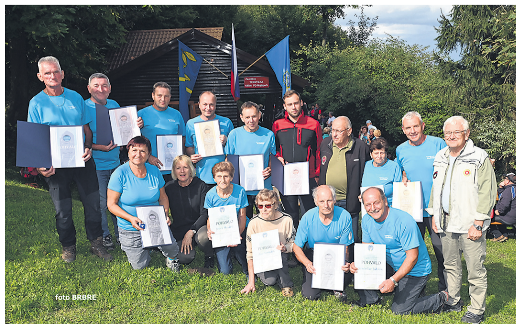
Prejemniki priznanj ob 70-letnici