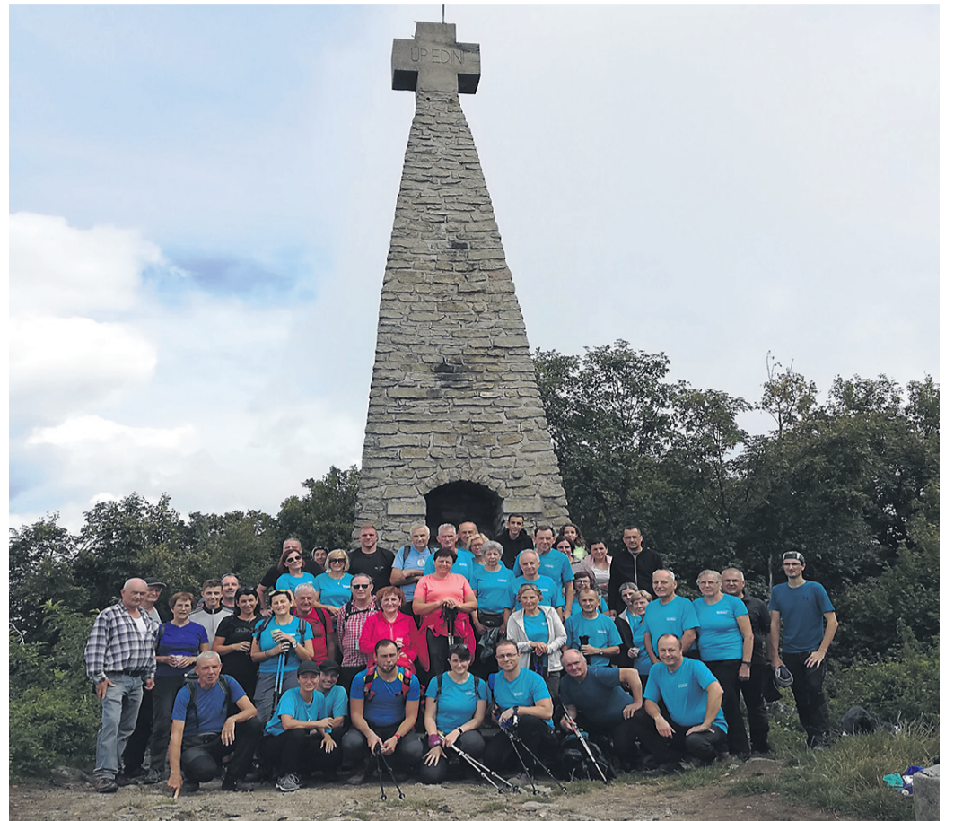
V počastitev 70-letnice so se člani TD Majšperk podali na Donačko goro, podelitev priznanj Planinske zveze pa je potekala nekoliko nižje, ob prenovljenem zavetišču Tekstilka.

Delovanje Planinskega društva Majšperk je v lanskem letu močno omejila epidemija, predvsem ukrep, ki je preprečeval združevanje ljudi na prostem. To je zanj pomenilo, da niso mogli organizirati skupnih pohodov, zato so člane pozvali, naj se čim več rekreirajo sami oz. v krogu družine. »Ker so bile občinske meje zaprte, nismo mogli nikamor. Planinci pa komaj čakamo, da osvojimo kak novi vrh in vidimo še kaj drugega kot naše domače hribe. Zato smo bili še toliko bolj veseli letošnjega maja, ko smo lahko ponovno začeli planinariti v skupinah, pa tudi izlete v druge slovenske kraje smo že lahko začeli izvajati,« je pojasnil Smolej. Letos so se tako že podali na Slivnico – čarovniško goro nad Cerknjskim jezerom, pa na Vrnikovo Grintovec in Ajdno. Pred epidemijo so organizirali večdnevne izlete, zelo priljubljena so bila na primer