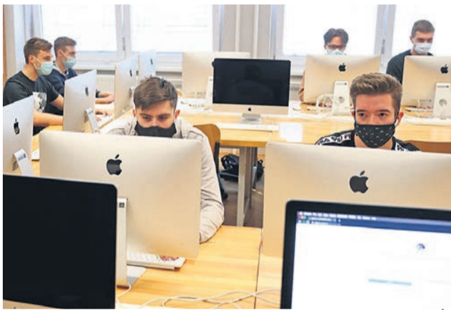
Dijak brez maske ne more biti pri pouku, če je tako zapisano v hišnem redu šole.

Kaj lahko storijo profesorji v primerih, ko srednješolci zavračajo nošenje maske? Šolsko ministrstvo v takih primerih svetuje pogovor tako z mladostnikom kot njegovimi starši. Če pri tem niso uspešni, pa lahko podajo prijavo na Inšpektorat RS za šolstvo. »Zoper mladostnike, ki so dopolnili 15 let (in do polnoletnosti) in ne upoštevajo določb o obveznem nošenju mask, smo v skladu z določbami Zakona o prekrških zoper njih podali predloge za začetek postopka o prekršku na Okrajnem sodišču, Oddelku za prekrške. Ob tem je treba poudariti, da se vsi postopki začnejo izključno na podlagi obvestila šol, ki omenjeno problematiko zaznavajo v svojih prostorih. Pri čemer pa imajo srednje šole možnost, da nošenje mask določijo kot obveznost v hišnem redu. To posledično pomeni, da mladostnik brez zaščitne maske ne more biti prisoten pri pouku, pri tem pa tudi ne krši določil o nošenju mask.