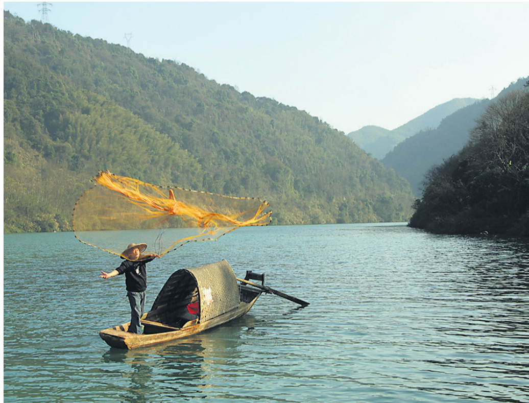
Ribič pri metanju mreže