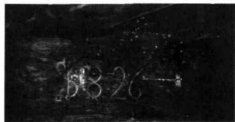
Letnica na nosilnem tramu v bajti

Mati Helena je umrla že leta 1816. Zapuščinsko obravnavo so začuda delali šele leta 1829. Njen delež so dedovale mladoletne hčere iz prvega zakona: Jera, 19 let