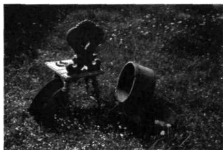
Starinski predmeti iz Janeževe bajte

Celoten prikaz teh raznih pogodb nam pokaže, da se je v zadnjih sto letih največ spremenilo, več kot prej v nekaj stoletjih. Premoženje si ob spremembah zelo natančno zaznamujejo. Zanimive so naturalne dajatve. Tudi klavzule dedovanja že v poročnih pismih (pred testamentom) so zanimive. Testament je sodil na starost, prej pa so takšna razmerja dognali že v ženitnih pismih, kjer so predvideli smrt, pa tudi različne stranpoti (nezakonski otroci). Teh momentov danes ni več,