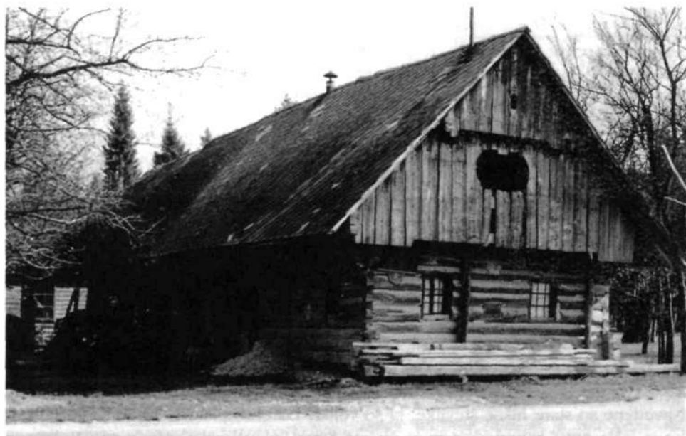
Janeževa bajta v Retečah po letu 1950