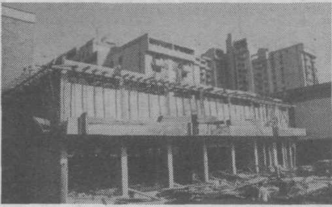
Močanska tržnica je zgrajena do smrečice.