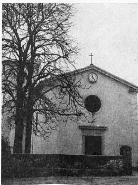
Župnijska cerkev v Trebčah

Od obiska gospoda nadškofa verni pričakujemo spodbude, da tudi navodil za bodoče delovanje za božje kraljestvo v naši župniji.