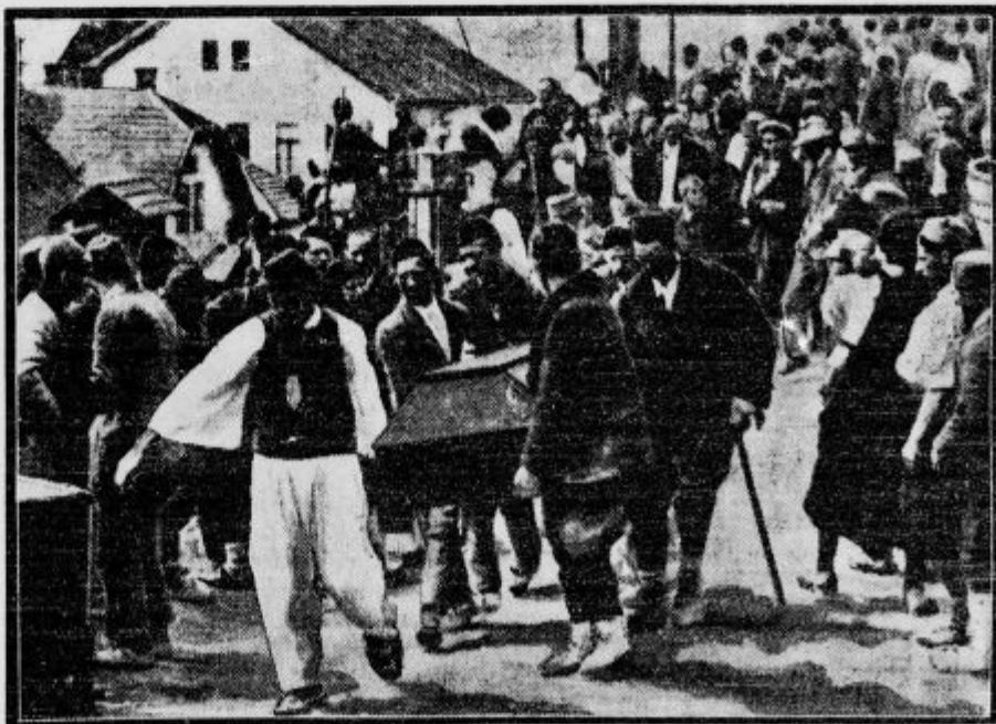
Prizor iz Kaknja. Rudarji nesejo svojega tovariša, ki ga je udušilo v rudniku, na pokopališče.