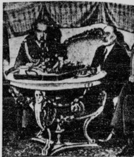
Francoški zunanji minister pri maršalu Pilsudskim, predsedniku poljske republike.

S parnim strojem 170 km na uro! To je moderni »lukamatija«. Zgrajen je tako, da čim bolj zmanjša zračni odpor, tudi kolesa so pokrita in kotel ima spredaj obliko granate. Kakor da bi vlak izstrelili iz lope moderne postaje in bi ta bliskovito brzel do druge lope naslednje postaje. Samo Bog ne daj, da bi se ta hlapen kam zaletel. Ubogi potniki potem, uboge — zavarovalnice.