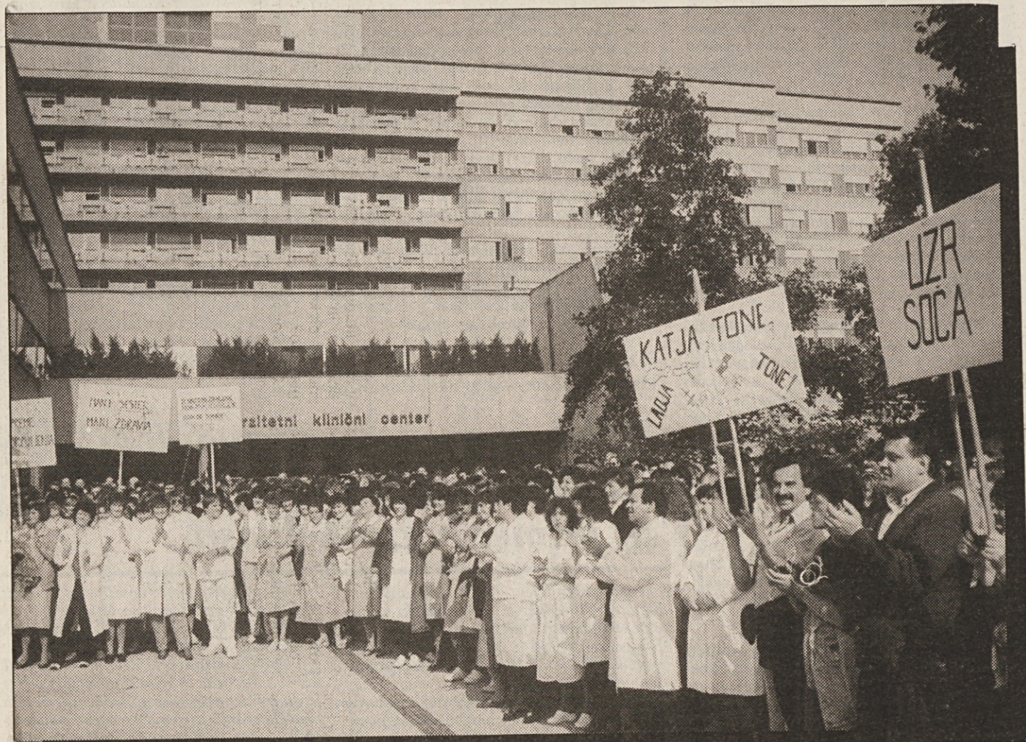
Univerzitetni klinični center – osmi dan stavke delavcev zdravstva in socialnega zdravstva

Odcepljanje Slovenije od Jugoslavije povzroča skokovito slabšanje položaja tistega dela gospodarstva, ki dokončno izgublja svoje trge in ki bo ostalo brez plačila za blago, prodano v Srbijo in druge dežele bivše Jugoslavije. V številnih podjetjih še danes ne vedo, kako bodo 18. oktobra napolnili plačilne kuverte. Država bo v nekaj dneh na pragmatičen ali bolj sistemski način morala rešiti vprašanje obstoja podjetij, ki so ogrožena zaradi povračilnih ukrepov ostankov socialistične Jugoslavije.