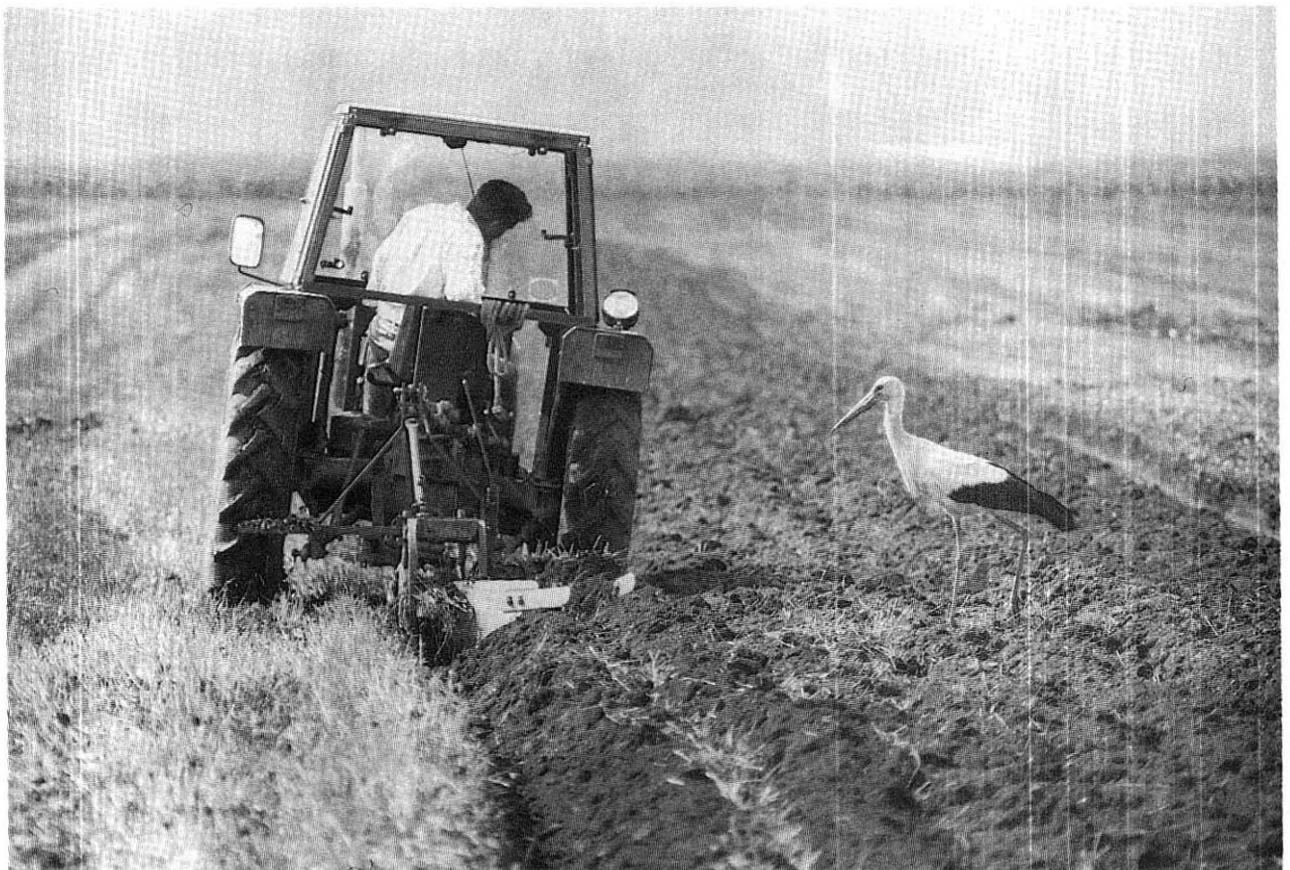
Foto 2. Na zamočvirjenih travnikih najde bela štorčlja vedno dovolj hrane, na osušenih in kultiviranih tleh pa mora beračiti za orači. Junij 1993 – Jovsi.

Območje je postalo naravovarstveno zanimivo ob koncu sedemdesetih let, ko so ob graditvi jedrske elektrarne v Krškem