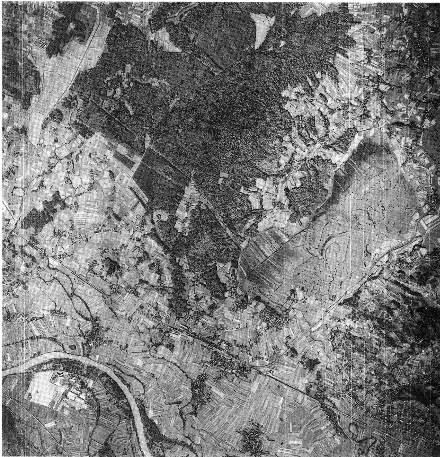
Foto 1. Pogled na Jovse in gozd Dobrava iz zraka. Levo spodaj je savski okljuk.

Evropi, najdemo med tukajšnjimi možnimi, verjetnimi in nedvornimi gnezdilci danes črno in belo štokljo, navadno čigro, vodmca, zlatovranko, sivo žolno in rjavega srakoperja. Med vrstami z razmeroma majhno svetovno populacijo, katere pomembni del pa je v Evropi, sta tu še kratkoprsti plezalček in grilček. Iz dana-