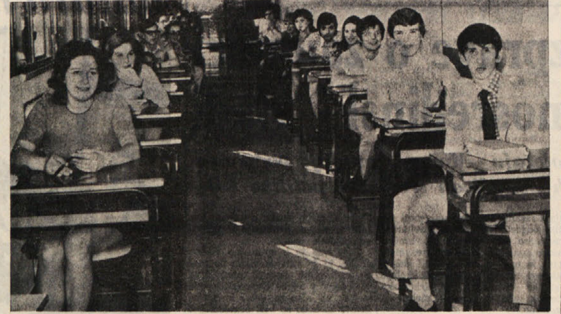
Nasmejeni obraz dijakov in dijakin na klasičnem liceju

Ministrstvo za šolstvo bi moralo na slovenske šole poslati naslove nalog v slovensščini