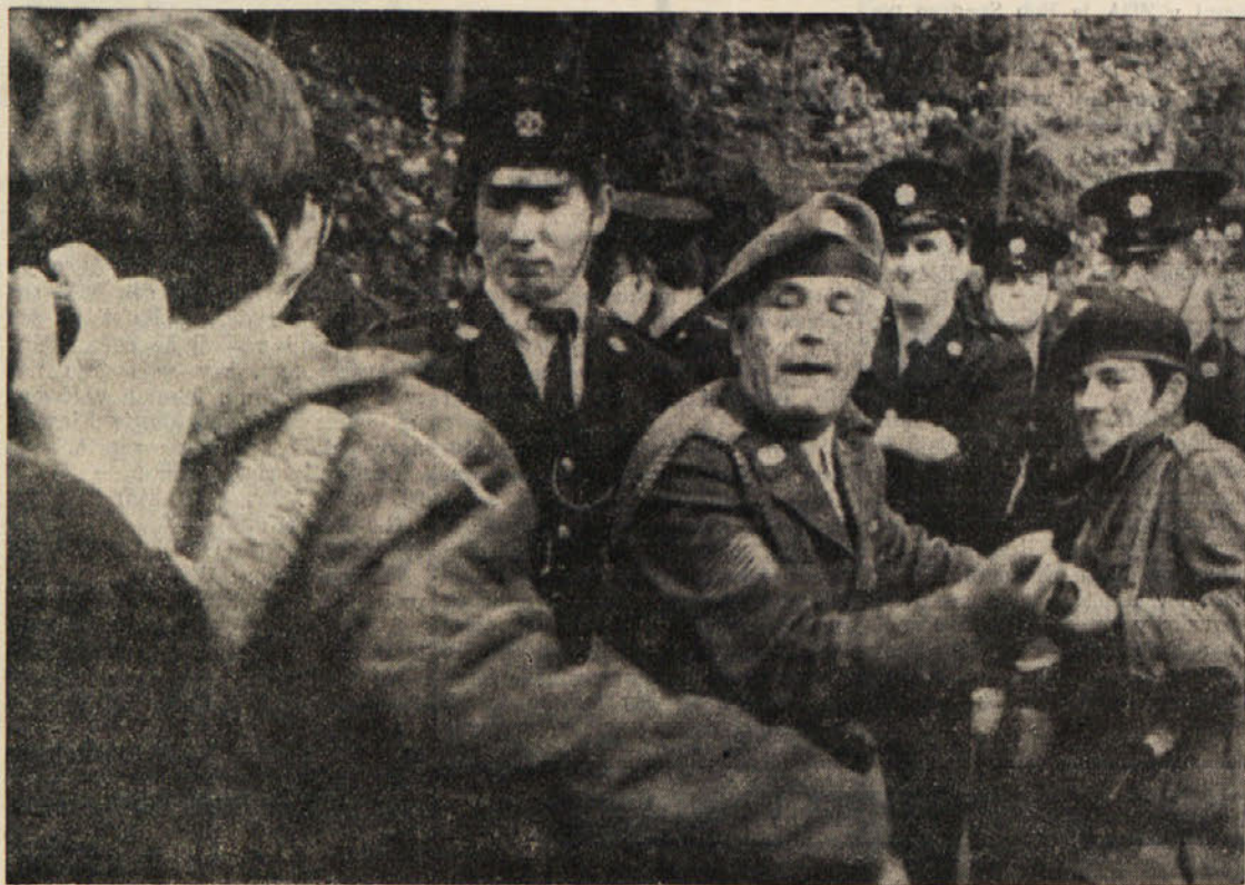
Irski policija in vojska z naperjenimi bajoneti odvrata demonstrante, ki protestirajo pred taboriščem, v katerem so zaprti irski roditelji

V Tel Avivu so tudi negativno ocenili sporazum med libanonsko vlado in Palestinci, saj bi ta, po izraelskem mnenju, ne rešil pravnega in vojaškega problema. Popoldnevnik Maariv piše, da bodo Palestinci odprli fronto na južnem delu Golanske planote. To pa bi le še zaostri položaj.