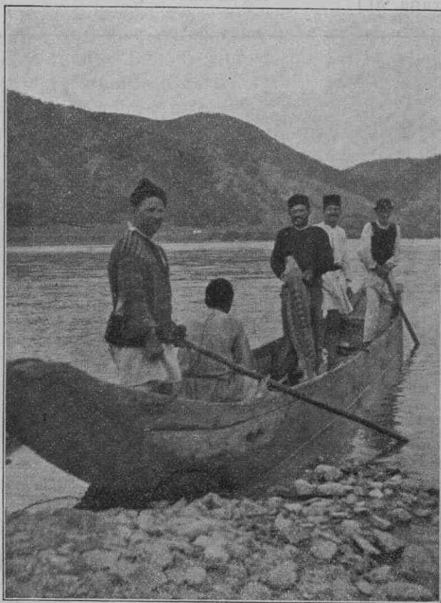
Povratak sa garde.

a u odstojanju od 4—5 metara. Ove tikve obeležavaju mesto gde su ribari svoje udice i čengele postavili. Seljaci ribari grade ovako te zamke za ribolov: proberu dve velike tikve, za koje privežu konopac dug 3—4 metra. Na donjem kraju konopca privežu veći kamen, a na polovini tih konopca privežu treći konopac kojim su oba ta konopca vezana a u odstojanju od 4—5 metra. Za taj