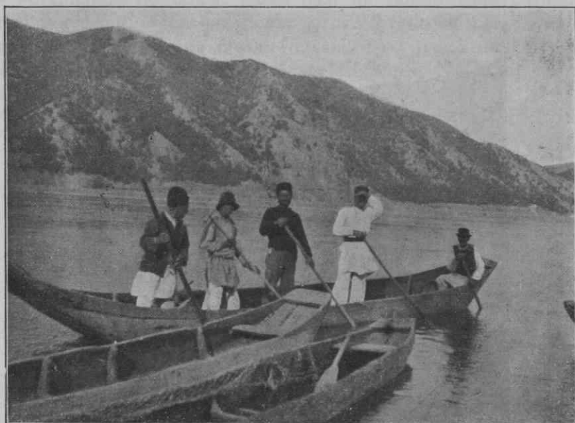
Polazak na garde iz sela Sipa.

ili prodaju još sveže, ili ga usole, ili pak naprave od njega marinat. Manje ribe obično prodaju kao sveže, ili ih takođe usole i tako prodaju. Ribolov na gardama, i u opšte, na Donjem Dunavu nije svake godine izdašan. Sledeći primer pokazuje kakav je bio ribolov u međuvremenu od 1919—1924. godine u okolini Kladova. (M. Savić: Naša Industrija, Zanati i Trgovina, deo V., strana 90.)