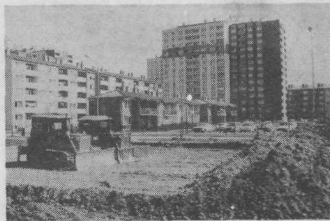
V Parmski ulici je že dalj časa primanjkovalo parkirnih prostorov. Zato se je KS odločila urediti nove parkirne prostore. Zemeljska dela so že skoraj pri kraju in upamo, da bodo na novih parkirnih krajih kmalu stali »konjički« našega časa.