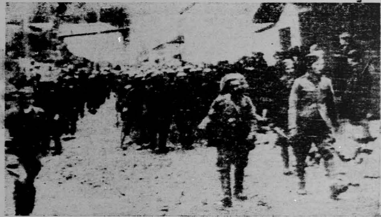
Ob navzočnosti velike množice meščanov peljejo partizanski vojaki veliko število ujetih Nemcev skozi neko osvobojeno mesto v Jugoslaviji.