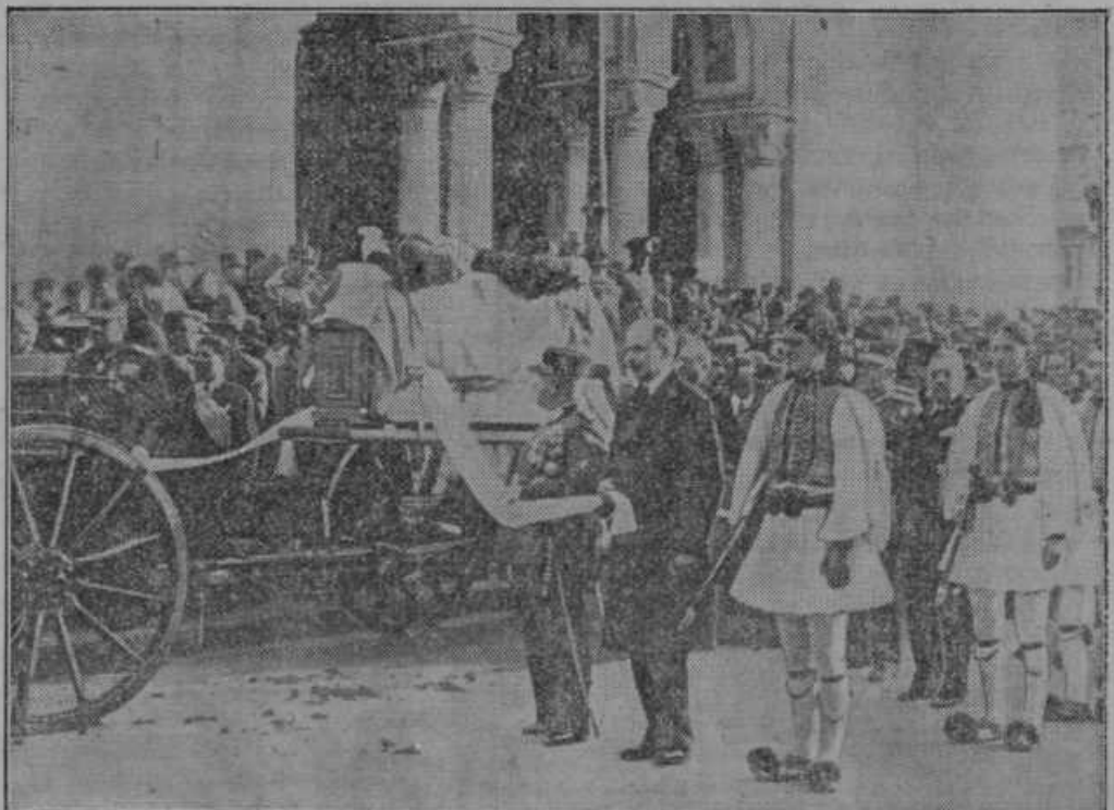
Slovesen pogreb grškega generala in politika Kondusa.