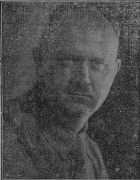
Viljem Gustloff, voditelj švicarskih hitlerjanciv, je bil ustreljen v Davosu od židovskega visokošolca Davida Frankfurterja.