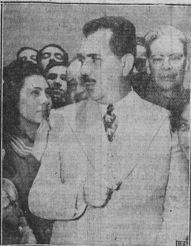
Mehiški predsednik Lazero Cardenas, ki je bil pozdravljen od prebivalstva na svojem potovanju po Mexicali dolini.