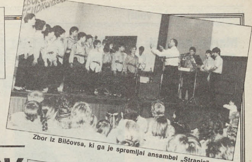
Zbor iz Bilčovsa, ki ga je spremljal ansambel „Stranje“