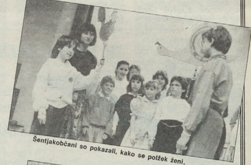
Šentjakobčani so pokazali, kako se polžek ženi.