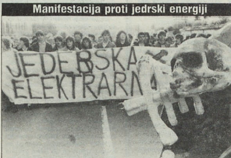
Nad 5000 ljudi je pretekli teden demonstriralo v Ljubljani proti jedrski energiji. (Več na str. 4/5.)

Wieser pa je ponudil čistega vina tudi v tej točki, da bo OBIR moral zapreti, če bosta dežela in zveza odklonili pomoč in podporo.