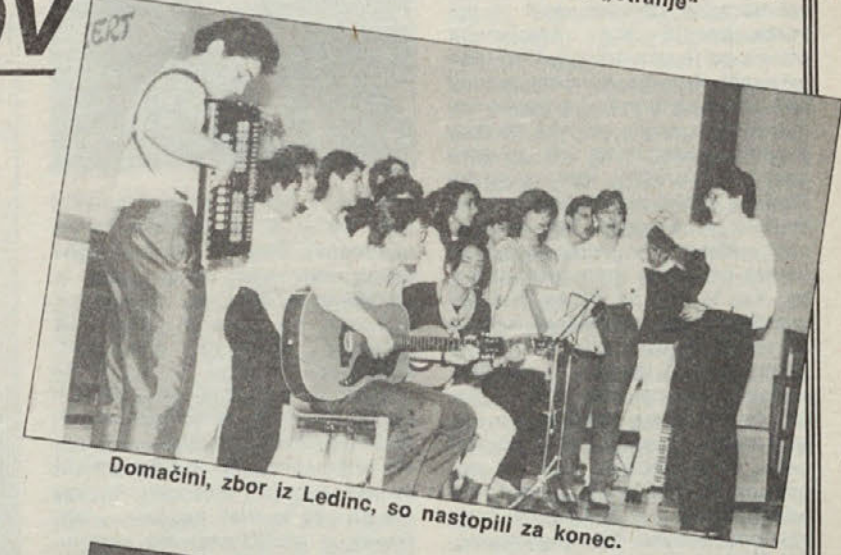
Domačini, zbor iz Ledinc, so nastopili za konec.