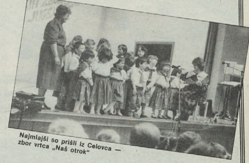
Najmlajši so prišli iz Celovca — zbor vrčca „Naš otrok“